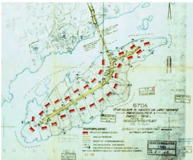
Figur 2 Utsnitt fra plankart til reguleringsplan 30360000

Kommunens arealplan (KPA) gjelder foran reguleringsplaner som er vedtatt før 1.1.2013 ved motstrid, jf. KPA § 2.4. Regulert bebyggelse (vist i figur 2) er i det vesentlige i strid med arealformålet grønnstruktur i KPA (vist i figur 3), hvor det ikke er tillatt med tiltak som ikke fremmer naturmangfold eller allmenn bruk. Reguleringsplanen Bønesholmen er av eldre dato, vedtatt etter bygningsloven av 1924. Søknad om en rekke tiltak utløser derfor krav om utarbeidelse av ny reguleringsplan i dag, jf. KPA § 3.1.