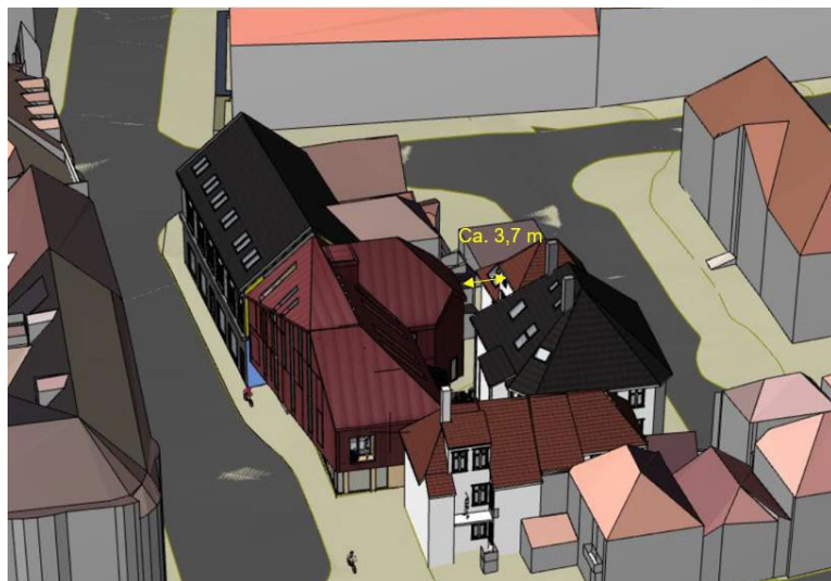
Figur 8 Avstand mellom bakbygg og Asylplassen 7

Reguleringsplanen synes m.a.o. å legge opp til en vesentlig økning i byggehøyden og utnyttingsgraden sammenlignet med eksisterende situasjon.