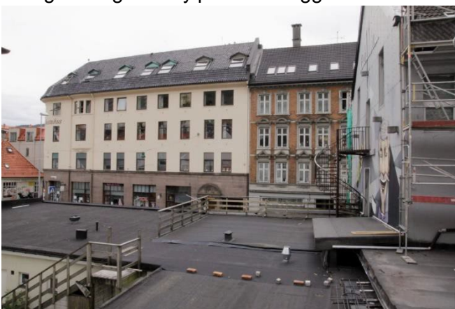
Figur 6 Utsikt fra 2. etasje

Bygningens 2. etasje har gulvflate omtrentlig på nivå med dagens bygning i Kong Oscars gate 46-48, og har dermed visuell kontakt med Kong Oscars gate. Se bilder under tatt fra 2. etasje ut mot gaten og fra Asylplassen/Heggebakken.