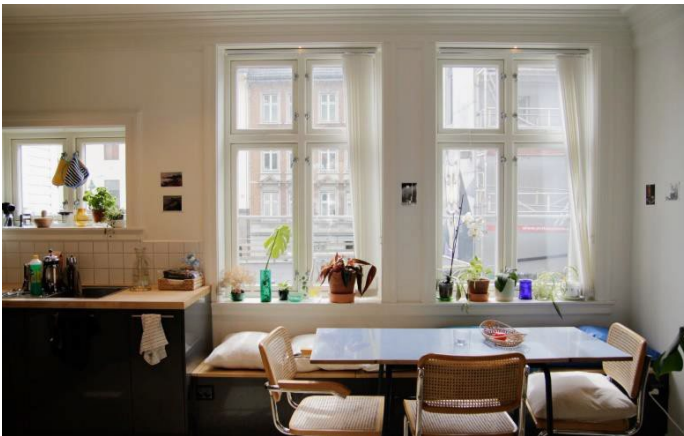
Figur 5 Kjøkkenen 2. etasje

Bygningens 2. etasje har gulvflate omtrentlig på nivå med dagens bygning i Kong Oscars gate 46-48, og har dermed visuell kontakt med Kong Oscars gate. Se bilder under tatt fra 2. etasje ut mot gaten og fra Asylplassen/Heggebakken.