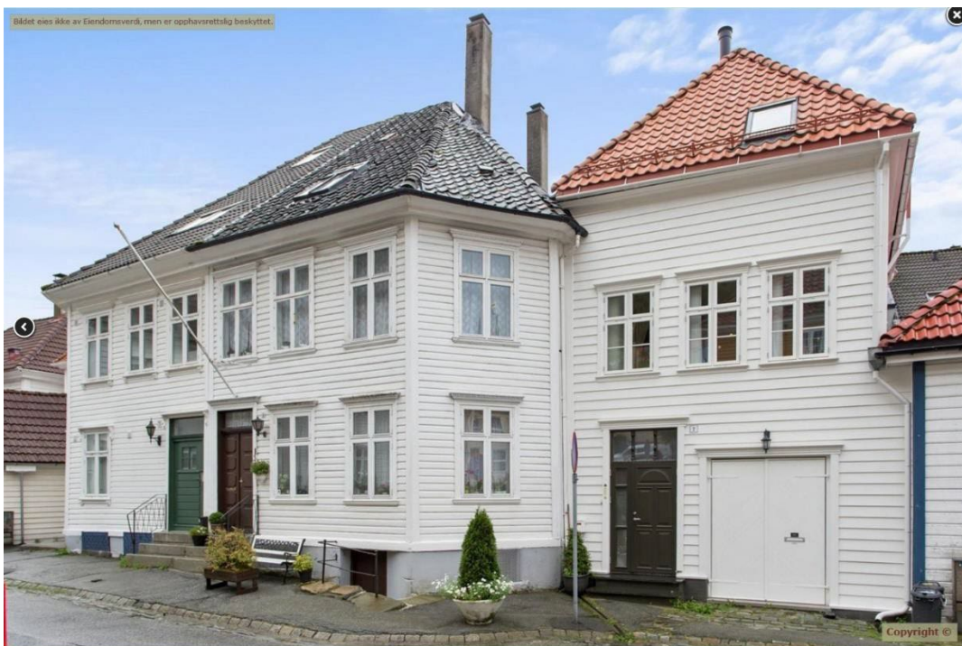
Figur 2

Boligens oppholdsrom er gjennomgående i 2. etasje, bestående av stue med åpen kjøkkenløsning. Da fasaden inn mot bakgården er sørvestvendt, er denne fasaden den viktigste kilden til sollys inn i boligen. Se bilder under av oppholdsrommet.