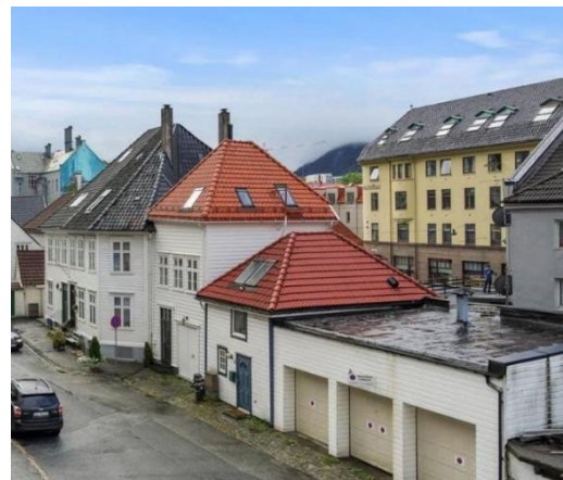
Figur 7