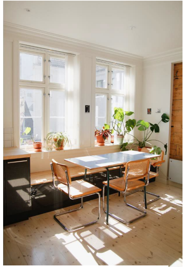
Figur 3 Bilde tatt på formiddagen