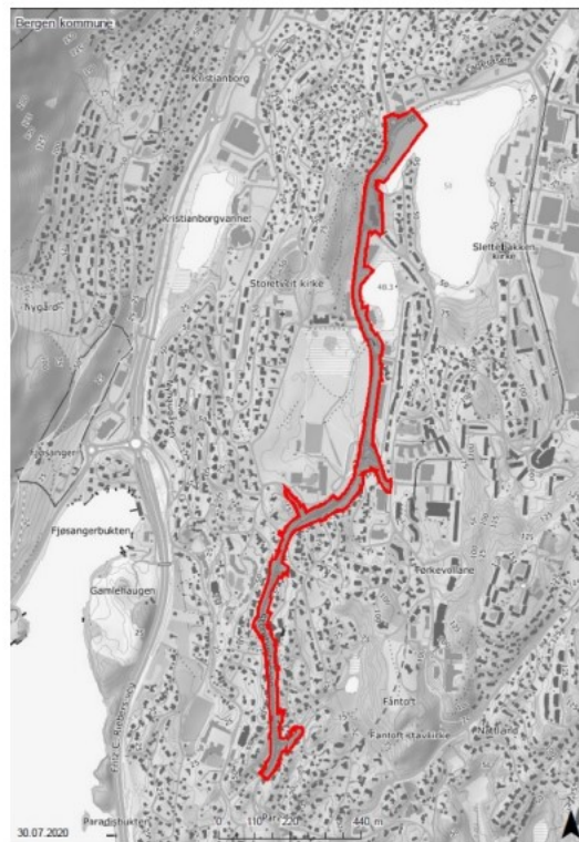
Figur 2: Planområdets avgrensning.

Planforslagets hovedformål er å legge til rette for en trafiksikker løsning for syklister og gående langs strekningen, som sikrer god fremkommelighet. Storetveitveien har i dag ikke et eget tilbud til syklister. Gående og syklende deler det samme arealet, noe som medfører konflikter og hindrer effektiv transportsyking. Prosjektet skal overordnet bidra til at flere velger gange og sykkel som transportmiddel.