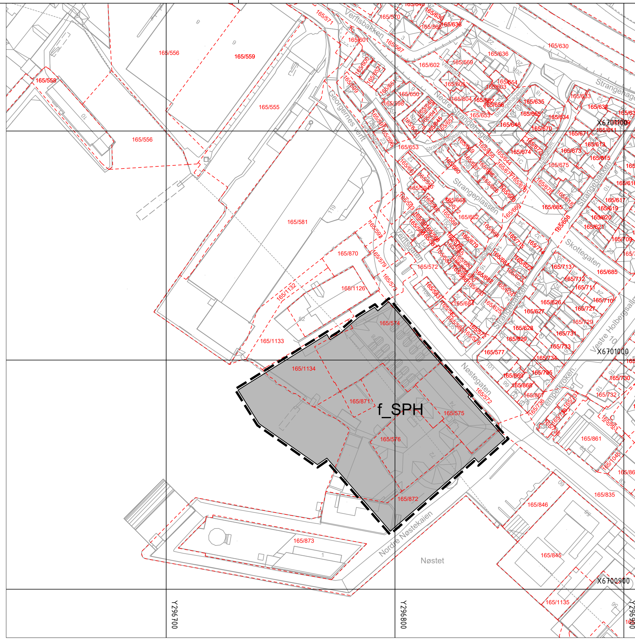
Vertikalnivå 1 (under bakken), M=1:1000