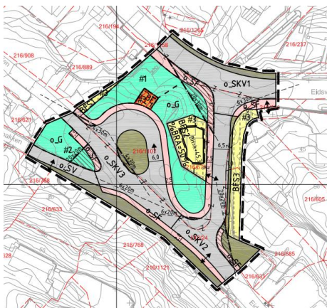
Utsnitt forslag til reguleringsplan

Planområdet er på ca. 5,2 dekar og omfatter et område mellom veiene Eidsvågsveien, Eidsvågskogen, Trolldalen og Trollbakken. Den aktuelle eiendommen hvor det skal etableres snusløyfe eies av Bergen kommune og benyttes i dag som riggområde/lagerområde.