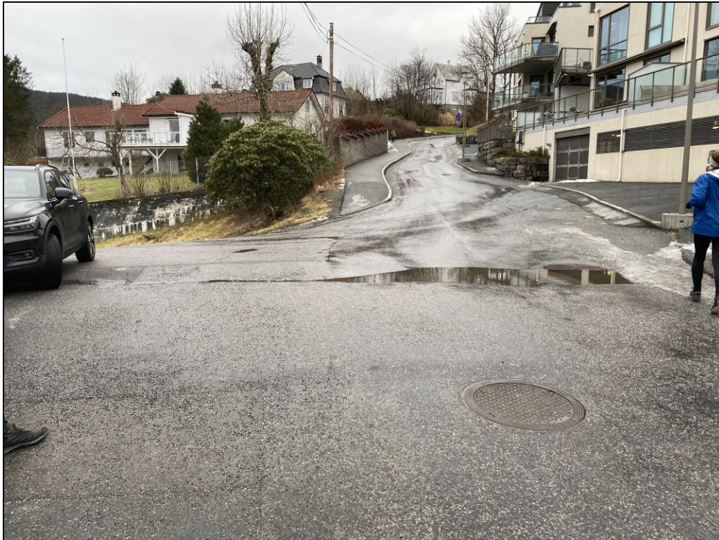
Figur 3. I dag er det en nedslitt fartshump i kryssområdet som kan utbedres/forsterkes.

I det aktuelle kryssområdet er det tilrettelagt for å kunne holde hastigheten for biltrafikken lav. Dette kan forsterkes gjennom utbedring av eksisterende fartshump.