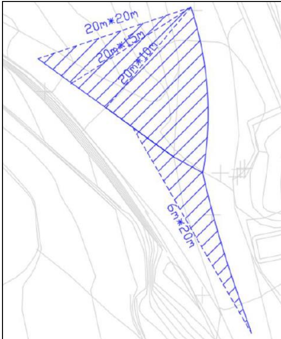
Figur 1. Siktretrekanter i krysset (Sweco).

Det er imidlertid mulig å oppnå 20m x 10m med enkle grep (vegetasjonsrydding).