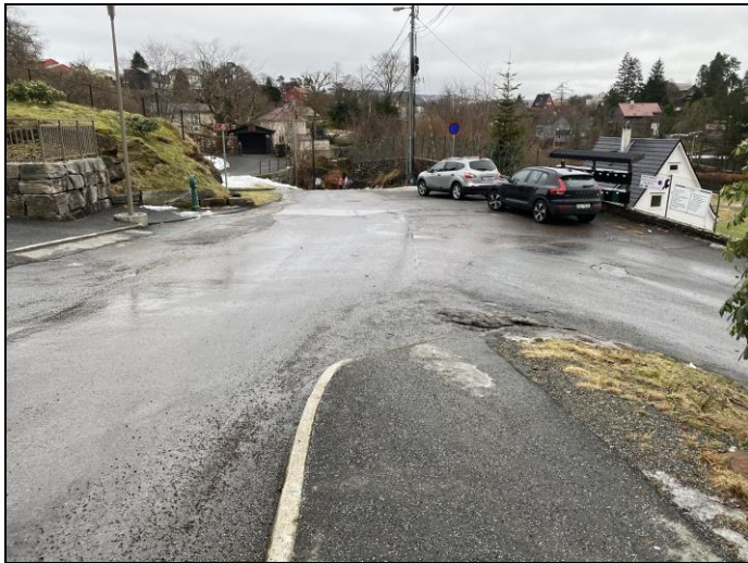
Figur 5. Trafikkøy/gangareal ved postkassene vil gi et mindre utflytende kryssområde og et «landingsareal» for kryssende gangtrafikk. I tillegg vil trafikkøyen redusere risiko for uønsket stans/parkering i kryssområdet som begrenser siktforholdene.

I tillegg til disse tiltakene anbefales det en nærmere vurdering av belysningen i kryssområdet, og eventuelt forsterket belysning der skolebarna krysser avkjørsel og der de ledes ut i kjørebane sør for krysset.