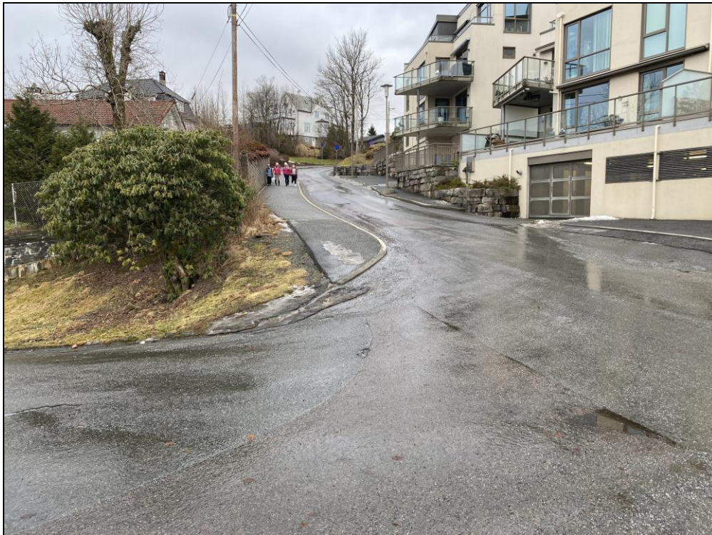
Figur 2. Hensynet til trafikksikkerheten for myke trafikanter er det overordnede hensynet i vurdering av kryssutforming og avbøtende tiltak.

Jacob Kjødes veg er en viktig forbindelse for gående og syklende, herunder skolebarn til/fra Paradis skole.