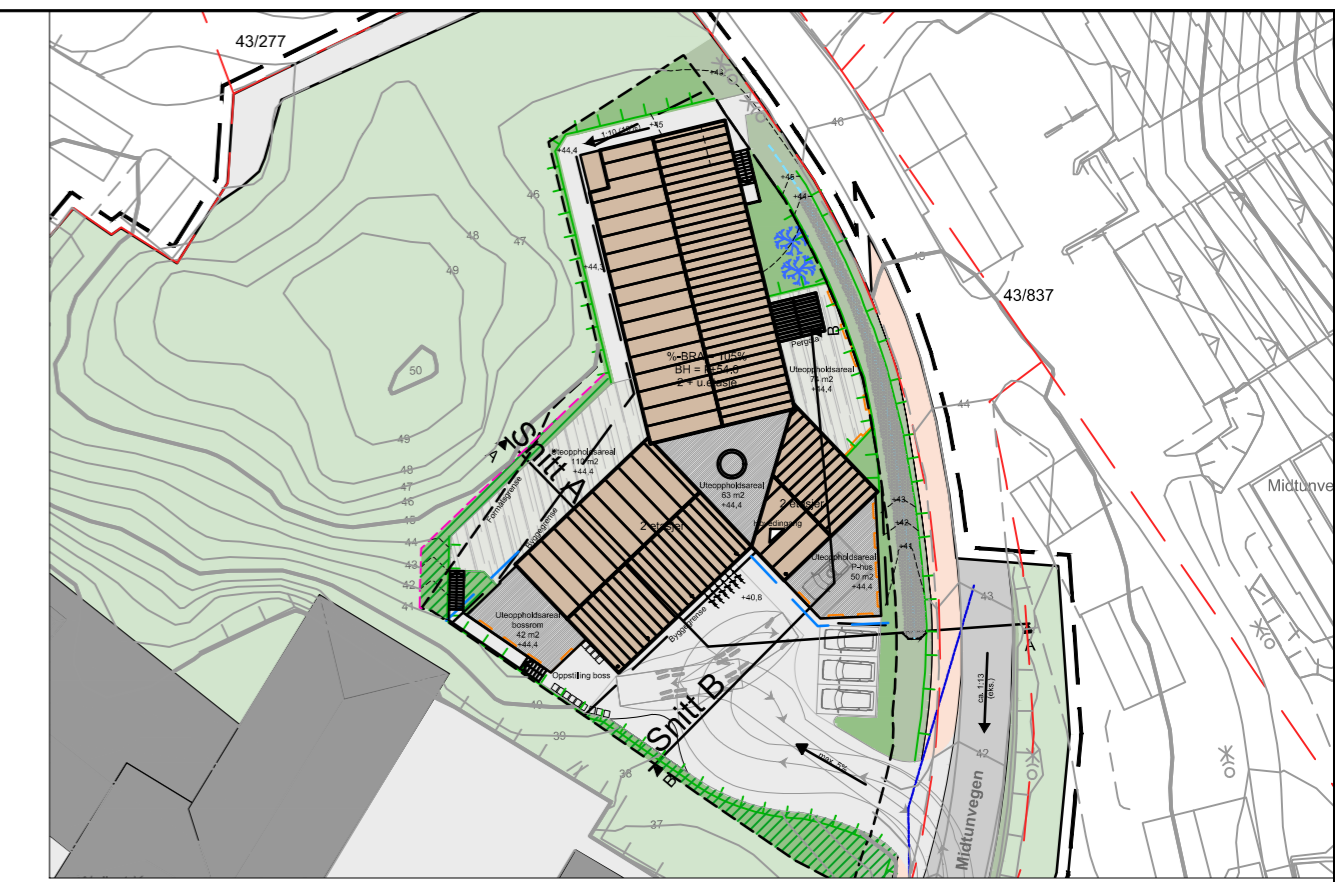
Utsnitt fra illustrasjonsplan tegn. L01