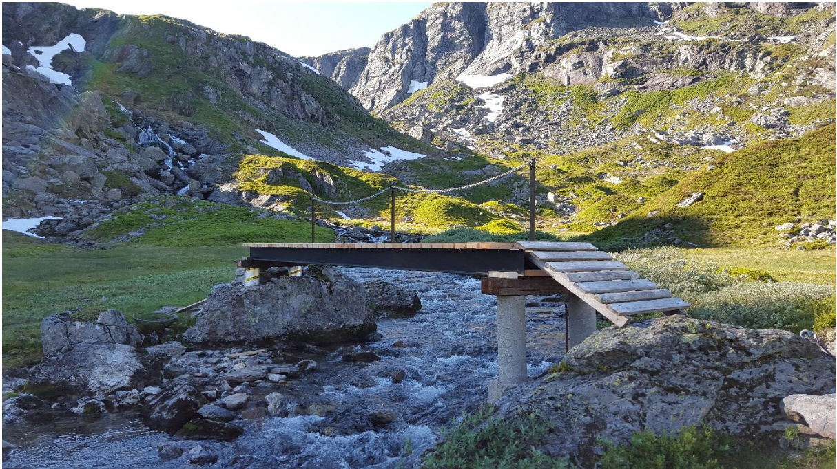
Bilde 5: Eksempel på søknadspliktig bro.

Vedlikehold av eksisterende bro er ikke søknadspliktig, men dersom vedlikeholdet innbefatter reparasjon av bærende konstruksjon eller fundament, er det søknadspliktig.