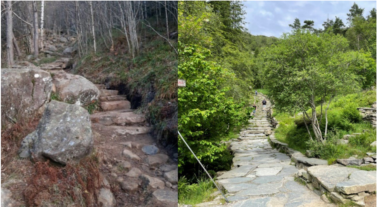
Bilde 3: Trappen til venstre er enkel tilrettelegging som ikke er søknadspliktig, her har eksisterende trinn og steiner blitt flyttet på for å lette ferdsel. Trappen til høyre er mer enn enkel tilrettelegging, og er derfor søknadspliktig.

sammenhengende trapper, som for eksempel «sherpatrapper» er søknadspliktige. Steintrapper av stort omfang krever også reguleringsplan.