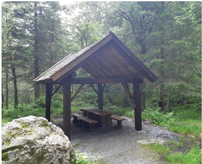
Bilde 6: Et grindverksbygg som dette vil være søknadspliktig.

Gapahuk kan være alt fra en enkel oppføring av greiner, til et bygg med tre vegger og tak. Sistnevnte er søknadspliktig. For etablering på kommunal grunn er det føringer for hvordan en gapahuk skal utformes.