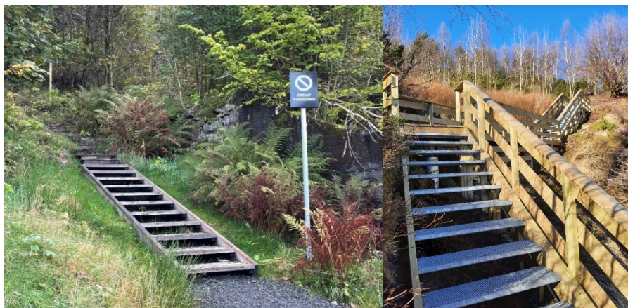
Bilde 4: Trappen til venstre ligger i terrenget og krever ikke søknad. Trappen til høyre er hevet fra terrenget og er søknadspliktig.

Trapper på terreng er ikke søknadspliktige. Større trapper, som ikke ligger på terreng, regnes som en konstruksjon. Dette vil være søknadspliktig. Trapper av dette omfanget regnes ikke som «enkel tilrettelegging» og vil være i strid med formålet for området.