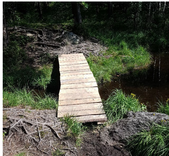
Bilde 2: Klopp som også fungerer som bro.

Å legge ned klopper i eksisterende tursti er i ikke søknadspliktig. Dersom det etableres sammenhengende klopper på flere hundre meter i forbindelse med etablering av ny turtrasé, vil det være søknadspliktig.