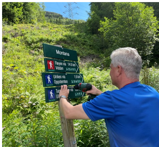
Bilde 1: Skilting er enkel tilrettelegging.

Tilrettelegging for friluftsliv er viktig for å gi tilgang til attraktive naturområder, og sikre gode opplevelser og folkehelse. Dette gjør at vi kan oppleve natur, stillhet og plante-, dyre- og fugleliv. Vi er heldige som får lov til å benytte naturen til rekreasjon, og derfor må vi ta vare på den – både for artene som lever der og ikke kan tale sin sak, og for våre fremtidige generasjoner. Dette underbygges av Grunnloven § 112 som sier at « Alle har rett til eit helsesamt miljø og ein natur der produksjonsevna og mangfaldet blit haldne ved lag. Naturressursane skal disponerast ut frå ein langsiktig og allsidig synsmåte som tryggjer denne retten òg for kommande slekter. ».