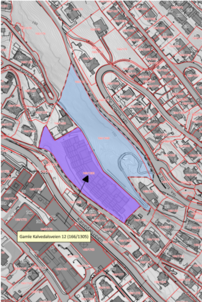
Figur 1 Merknadskart for arealplan-ID 5410000

Arealplan-ID 5410000. BERGENHUS. GAMLE KALVEDALSVEIEN 12.