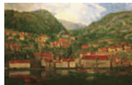
Ytre Arna før 1880. Maleri av Ole B. Eyde

Ytre Arna 180 år Kulturhuset Sentrum, Peter Jepsensveg 4 Konsert og lysbilete frå syngjespelet Elvæ. kr. 200 (TicketCo) Arr: Arne Sangforening og Ytre Arna Historielag