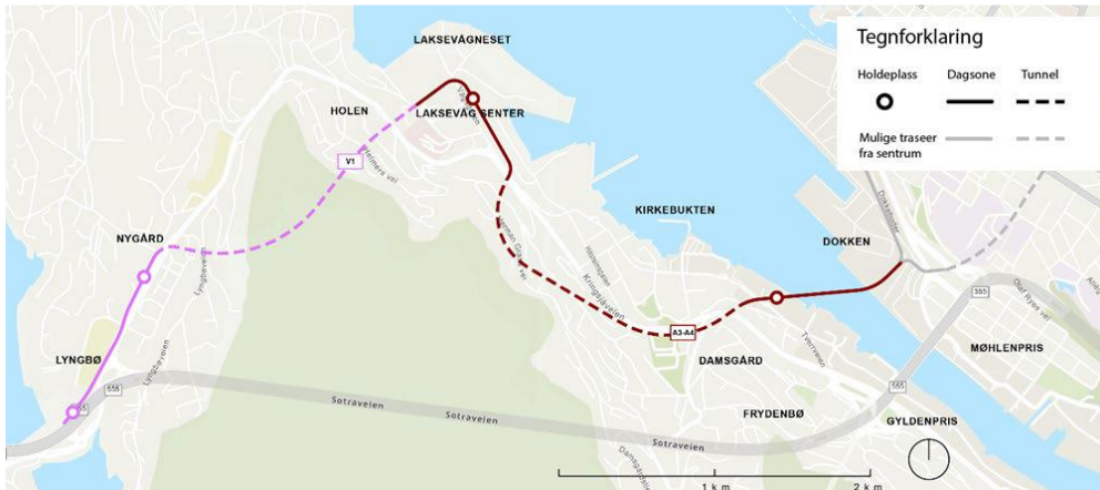
Kart som viser PBE sin anbefalte bybanetrasé mellom Dokken og Lyngbø.

Det er mulig å gjøre noe optimalisering av traséen A3-A4, og det vil undersøkes videre. Blant annet ses det på muligheten for 2 holdeplasser på Laksevågneset for bedre betjening av verftsområdet og gamle Laksevåg sentrum.