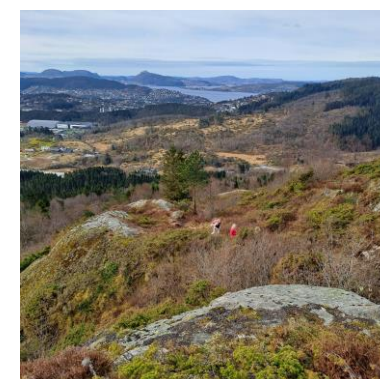
Tur til Vardefjell