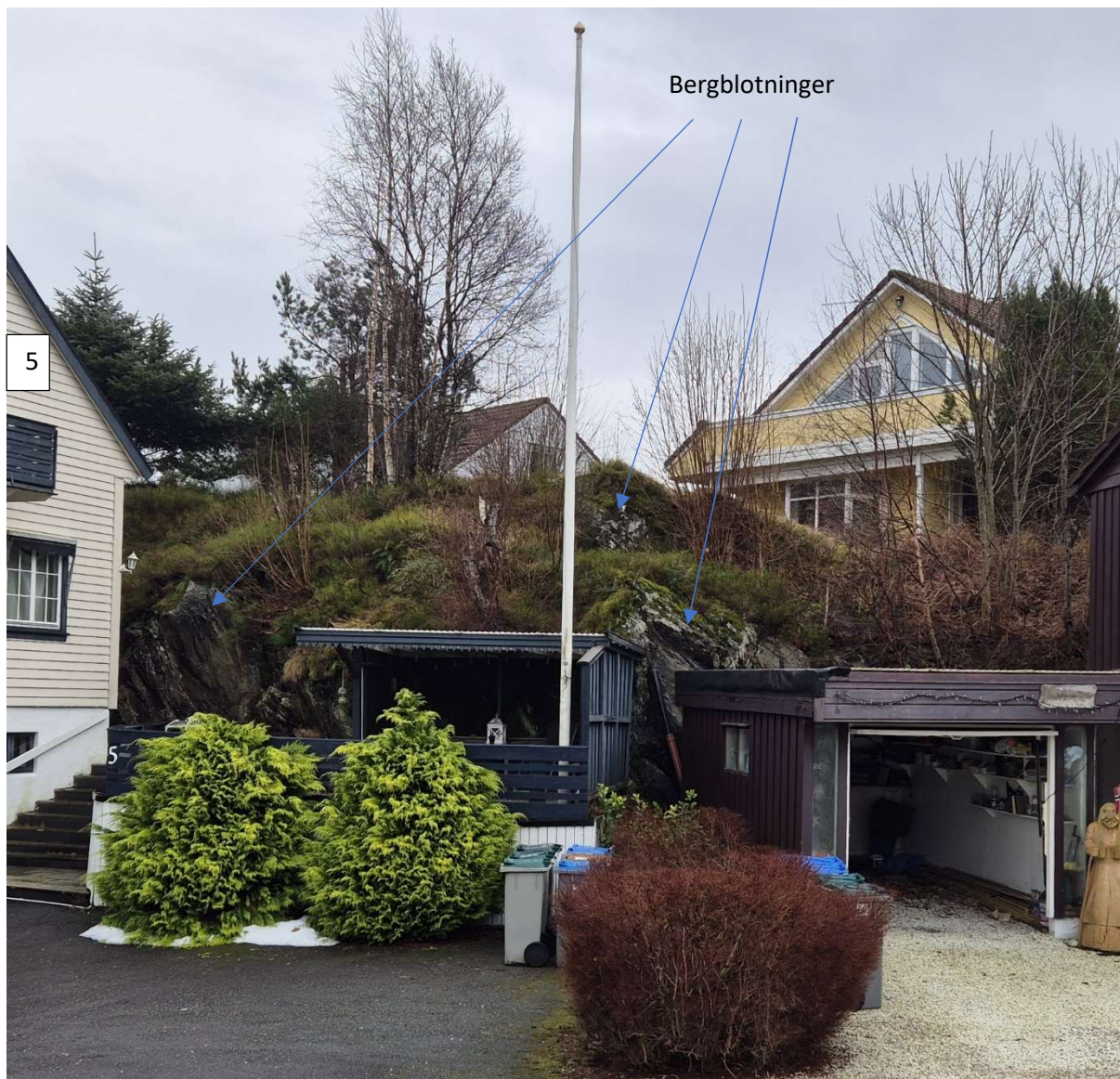
Figur 4 Bergblotninger ved Tors veg 5