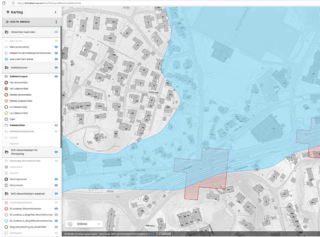
Figur 1: Aktsomhetskart for snøskred (rød skravur) og marin leire (blå farge), fra [3]

Det er gjort en nærmere vurdering av snøskredfare og av områdestabilitet for den aktuelle eiendommen. Vurdering av områdestabilitet er utført iht. NVEs kvikkleireveileder (ref. [2]).