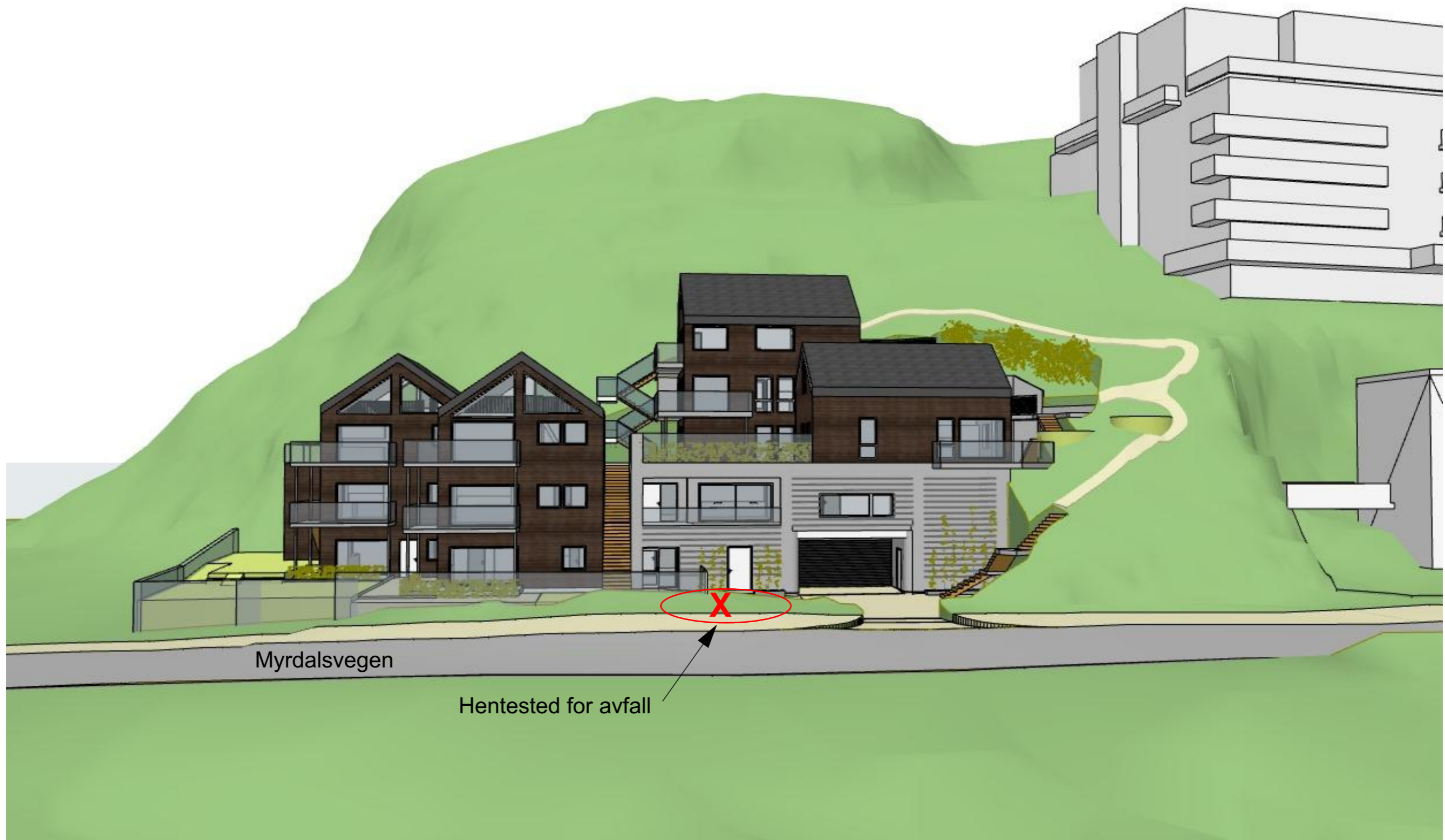
Myrdalsvegen 95. Perspektiv fra sør med hentested for avfall.