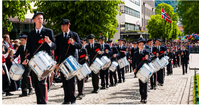
Ha ein fin 17. mai-feiring!

★ HUGS! Husk å ta med deg opplada Chromebook og dei bøkene du treng til skuledagen. Ha med skrivesaker, gymtøy og matpakke. Les nøye gjennom arbeidsplan og timeplan.