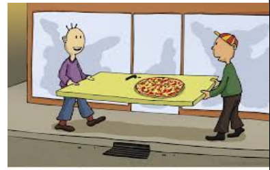
Cato og Fred har bestilt pizza på døren