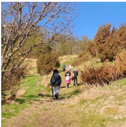
Tur til Ulsetvarden