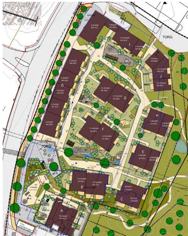
Figur 1: Oversikt over planlagt bygningsmasse.

COWI er engasjert av BoNo Bolig AS for å vurdere overordnede branntekniske forhold i forbindelse med forslag til reguleringsplan for et kombinert bolig- og næringsprosjekt i Ytrebygda, gnr. 114/bnr. 236, 258, 136 m.fl. Store Breiholten, i Bergen kommune. Planforslaget omfatter ny bebyggelse med byggehøyder mellom 3 og 13 etasjer samt underjordisk parkeringskjeller.