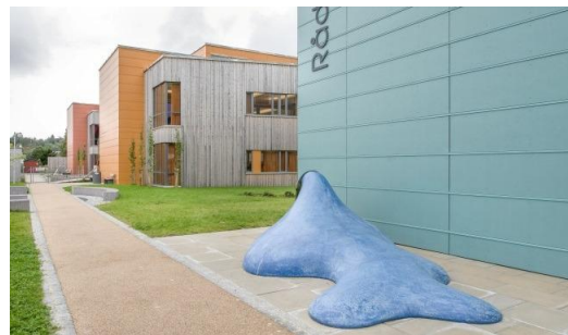
På 10. trinn: Innsats for andre

Opplæringen i valgfaget fysisk aktivitet og helse skal bidra til bedre helse og trivsel for den enkelte elev. Du skal kunne delta i varierte aktiviteter inne og ute. I valgfaget skal du få innsikt i betydningen av god balanse mellom energiinntak og energiforbruk. Opplæringen skal også bidra til å utvikle kunnskap og evne til å vurdere kostholdsråd og anbefalinger som er knyttet til daglig fysisk aktivitet.