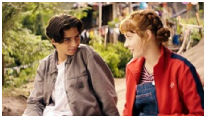
22. sept.: Skolen med de magiske dyrene – Venner for alltid.