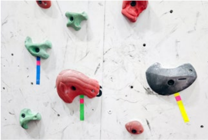
Klatrerute merket grønn er lett, blå er middels og gul er vanskeligere. Se side 4–7.