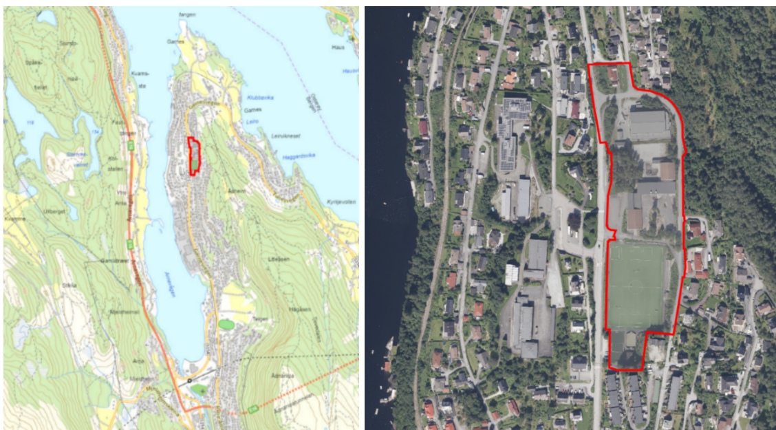
Figur 1 og 2. Planområdet er vist med rødt omriss.

Arkitektgruppen Cubus foreslår på vegne av Bergen kommune ved Etat for utbygging, detaljregulering for ny idrettshall på Garnes i Arna bydel. Hensikten med planforslaget er å erstatte dagens Bjørnarhall med en ny, større idrettshall.