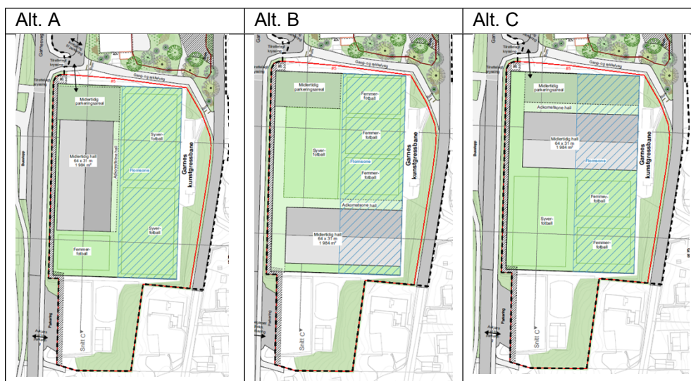
Figur 2. Utsnitt fra illustrasjonsvedlegg for de tre foreslåtte alternativene (A-C).

Ved begrenset høring kom det innspill angående plassering av den midlertidige hallen. Da planforslaget var til begrenset høring, ble det vist tre ulike muligheter for plassering av hallen innenfor bestemmelsesområde #5 i plankartet. I innspill fra naboer, er det to naboer som mener at alternativ C vil være best med tanke på sol og lysforhold for resten av banen. Rådet for byforming og arkitektur anbefaler alternativ B og mener at dette alternativet oppnår et samlet areal for barna, og det tar minst utsikt fra bebyggelsen mot øst. Plan- og bygningsetaten har ikke tatt stilling til alternativene (se Figur 2), men vurderer at forslagsstiller må finne den løsningen som best ivaretar de lokale interessene når det gjelder håndball og fotball, og naboer.