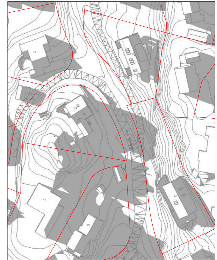
21. mai kl20