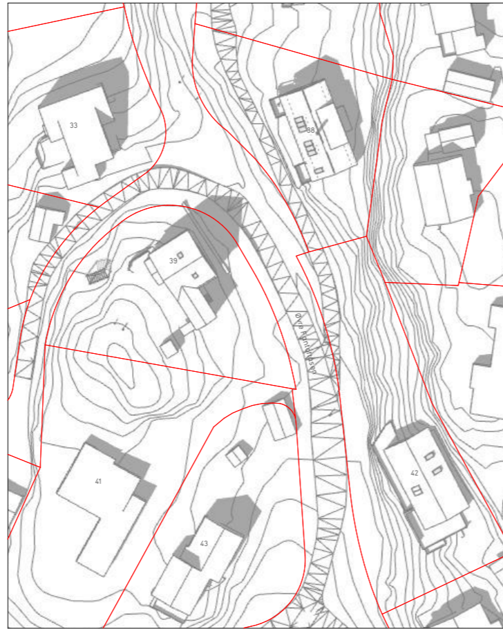
21. mai kl15