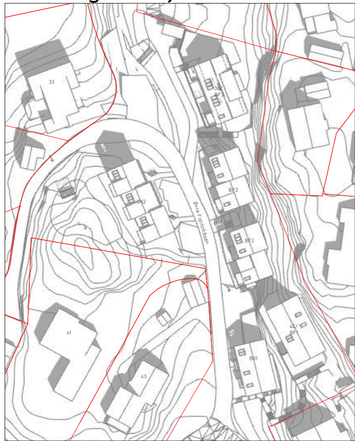
21. mai kl12