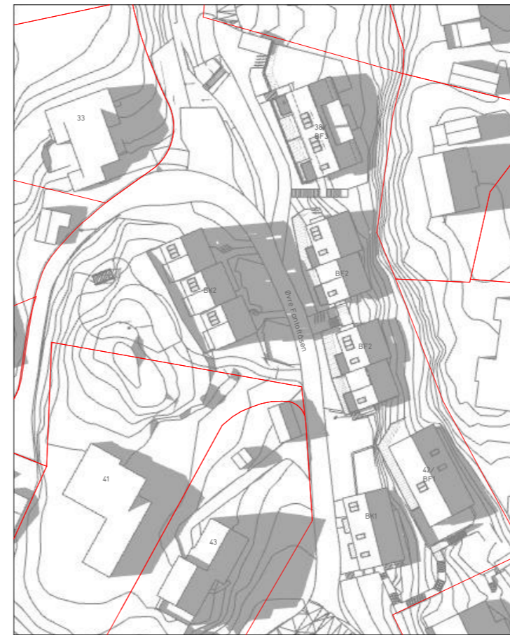
21. mai kl18