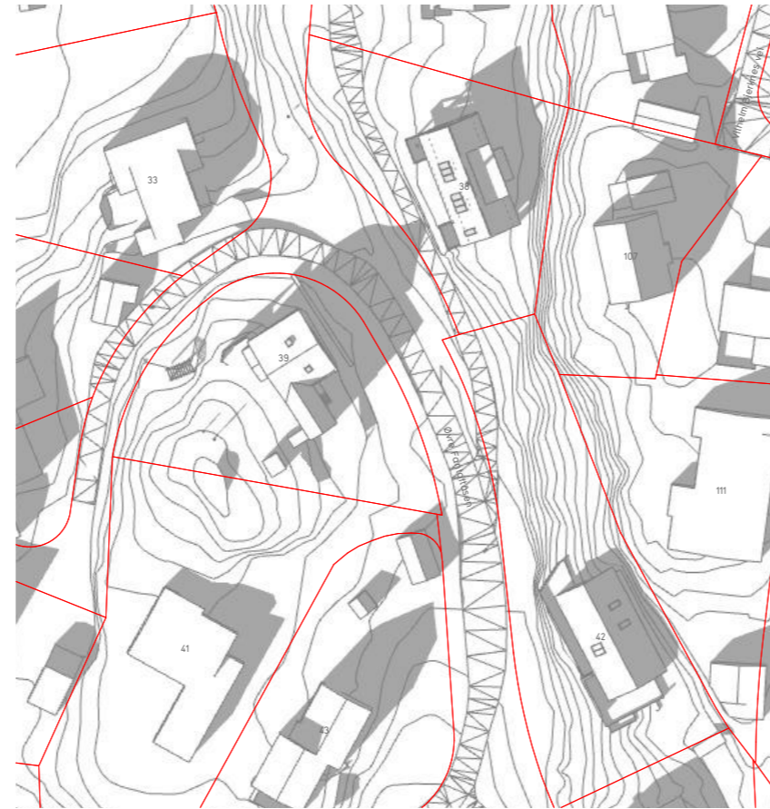
vårjevndøgn kl 15