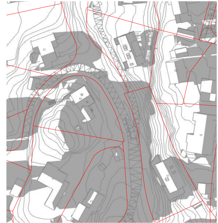
vårjevndøgn kl 18