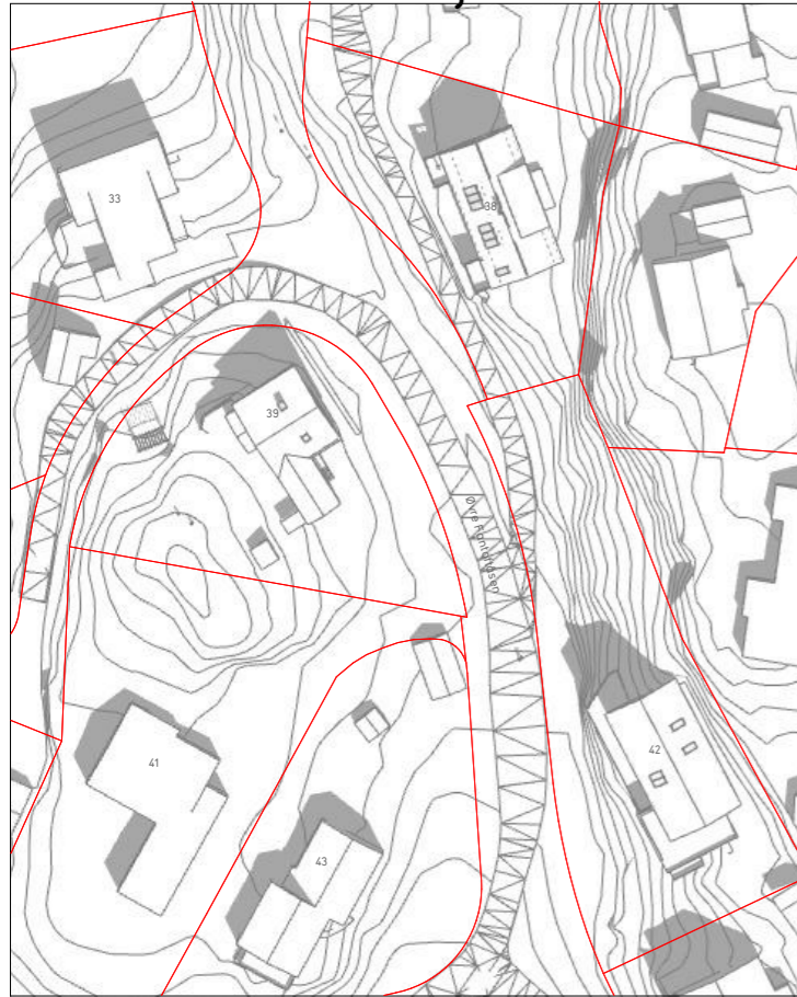
21. mai kl12