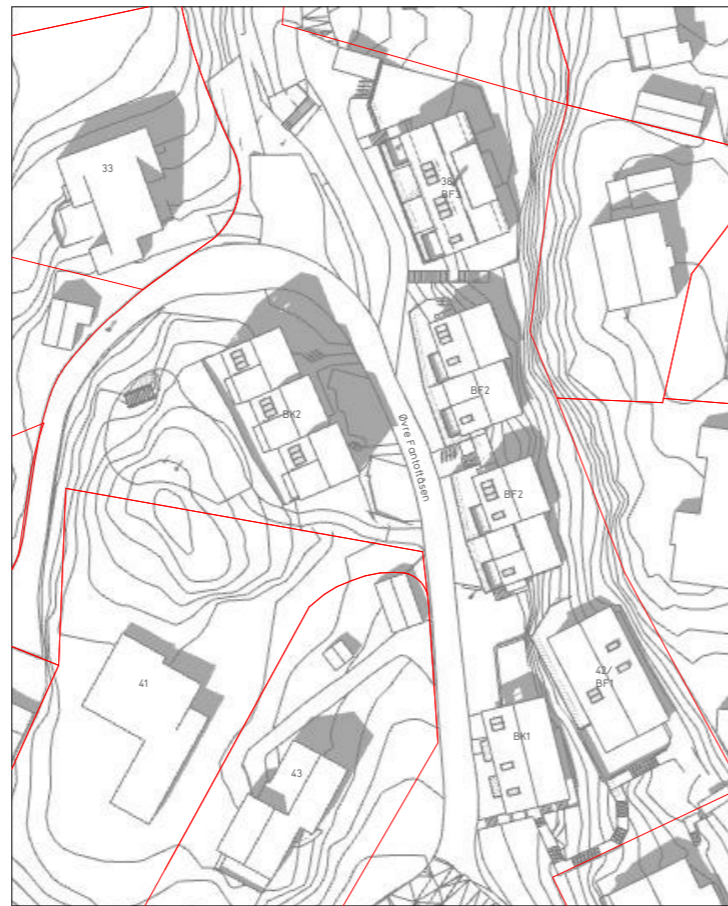
21. mai kl15