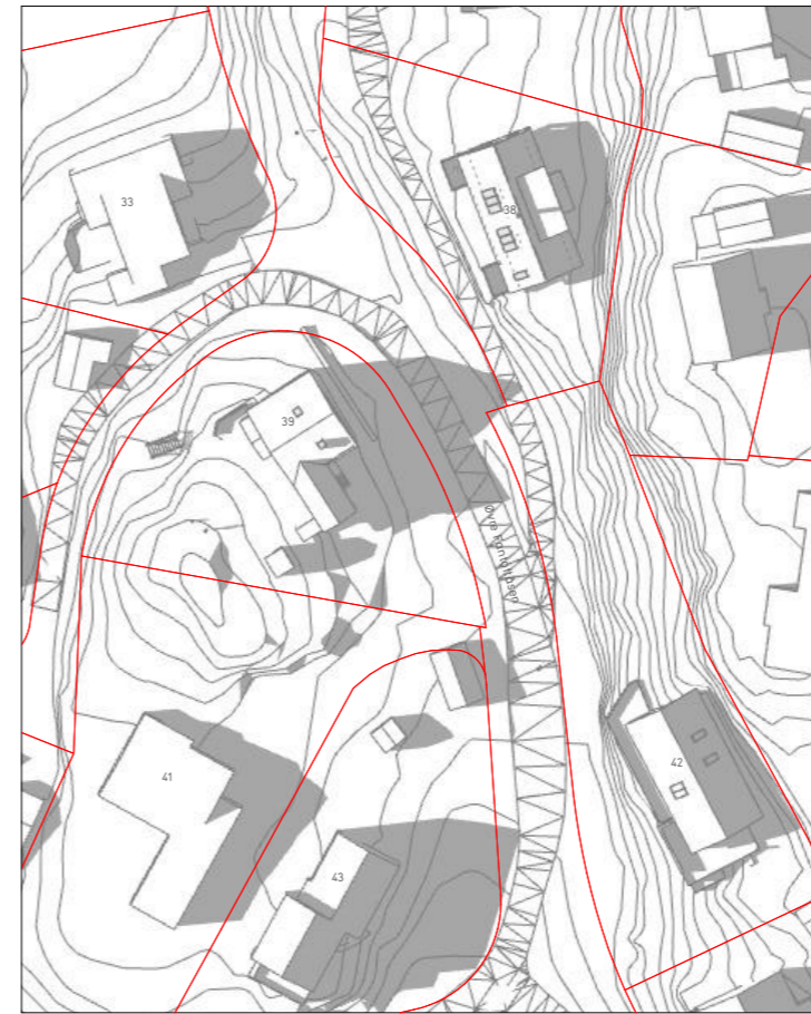
21. mai kl18