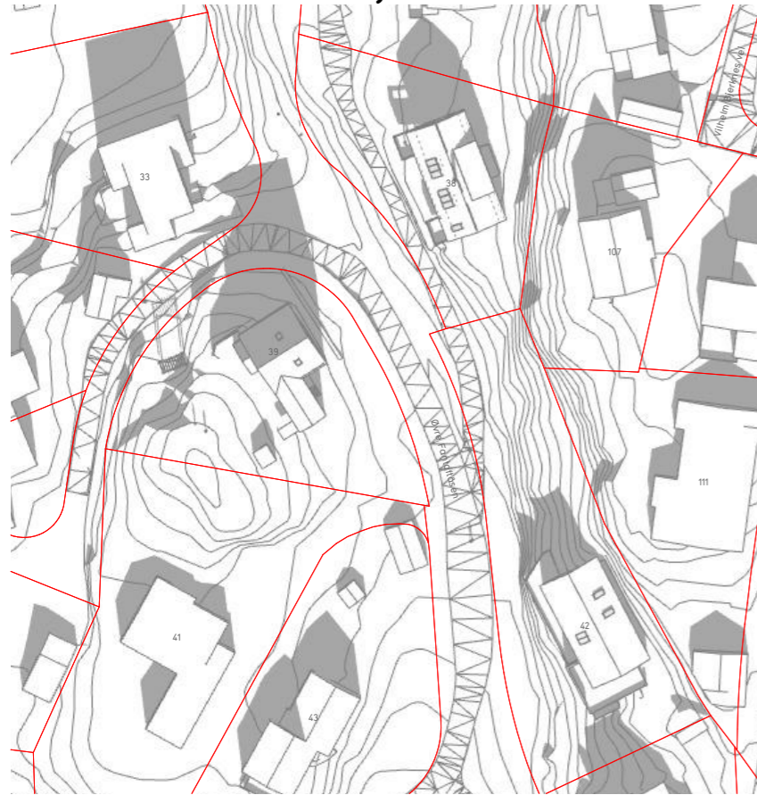
vårjevndøgn kl 12