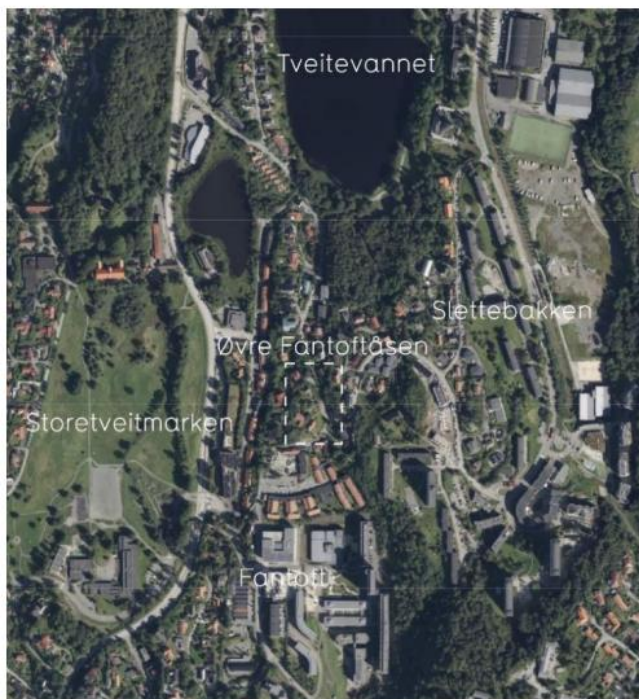
Hvit markering viser planområdets lokasjon

Planområdet ligger på Øvre Fantoftåsen i Årstad bydel, ca 6 km sør for Bergen sentrum. Det foreslåtte planområdet er en del av et område med frittliggende småhusbebyggelse mellom senterområdet i Fantoft i sør, og grøntområde/Tveitevannet i nord. Arealet er avsatt til byfortettingszone i KPA. Hensikten med planarbeidet er å legge til rette for fortetting på eiendommene som avgrensingen omfatter, 2/77, 12/104 og 12/33. I tillegg er en del av vegstykket Øvre Fantoftåsen inkludert for å tilrettelegge for tilkomst til nye boenheter, fortau og vegutvidelse sørover, samt bevaring av grøntområde med sti i nord. For å hensynta eksisterende avkjørster og murer ved planlegging av nytt fortau er det tatt med noe mer areal langs vegen.