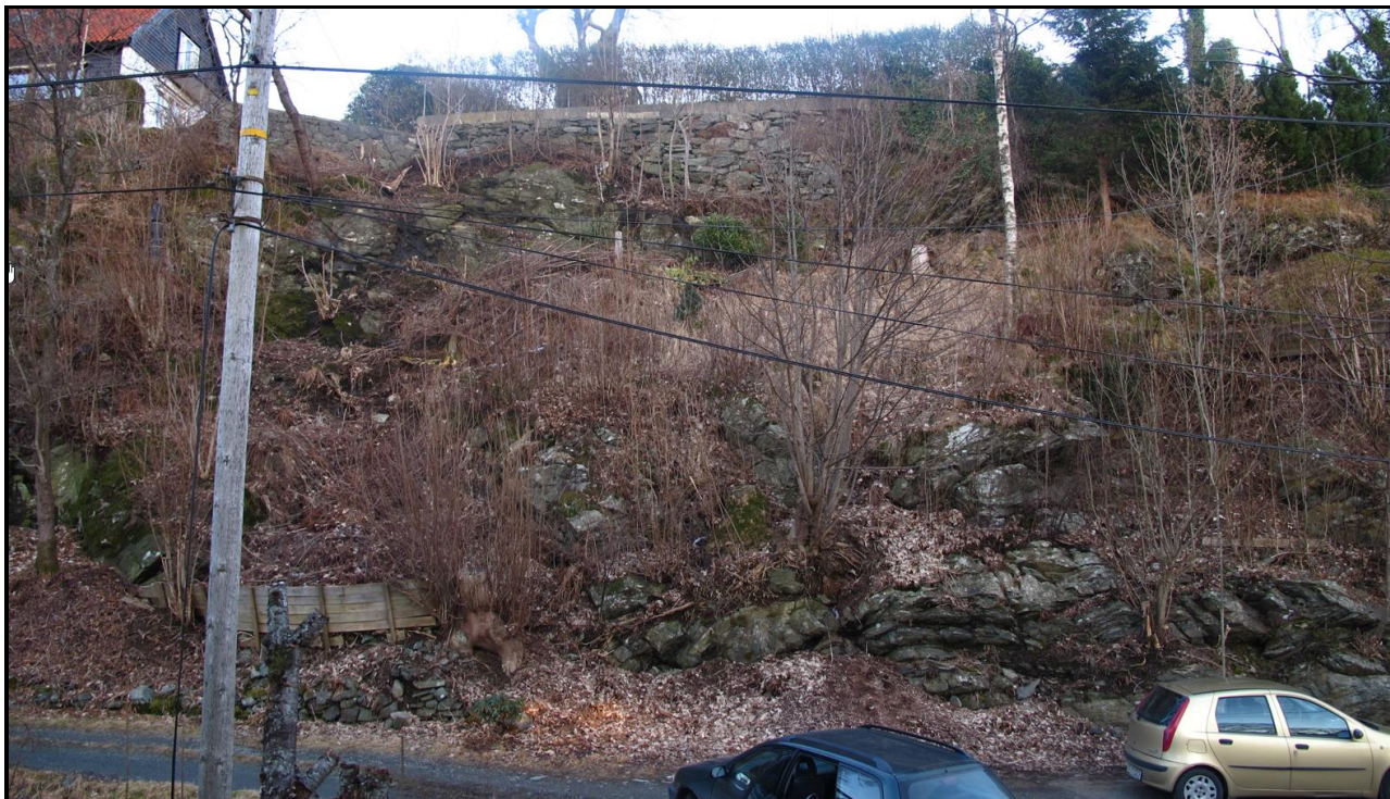
Figur 3. Deler av planområdet og den største skråningen i planområdet med flere løснеområder for steinsprang. Bildet er tatt i østlig retning.