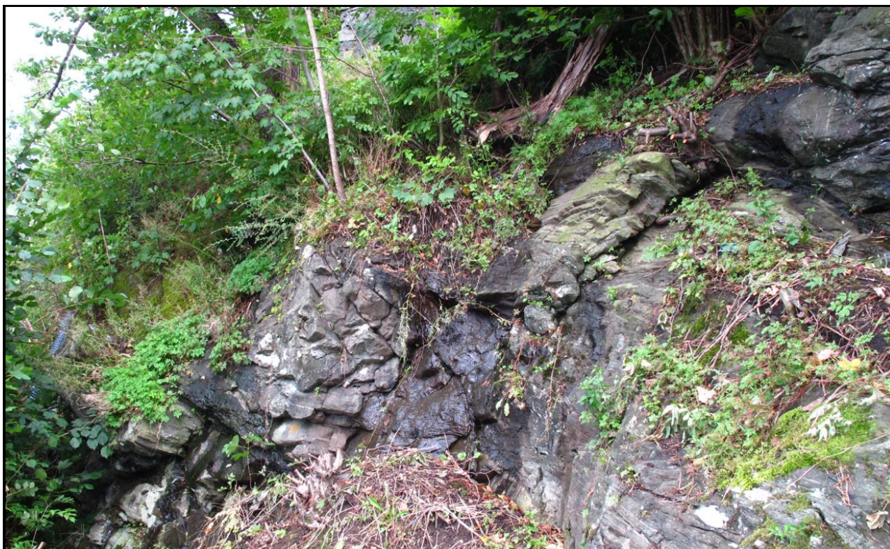
Figur 4. En av løснеområdene for steinsprang i skråningen i planområdet. Bildet er tatt i nordlig retning.