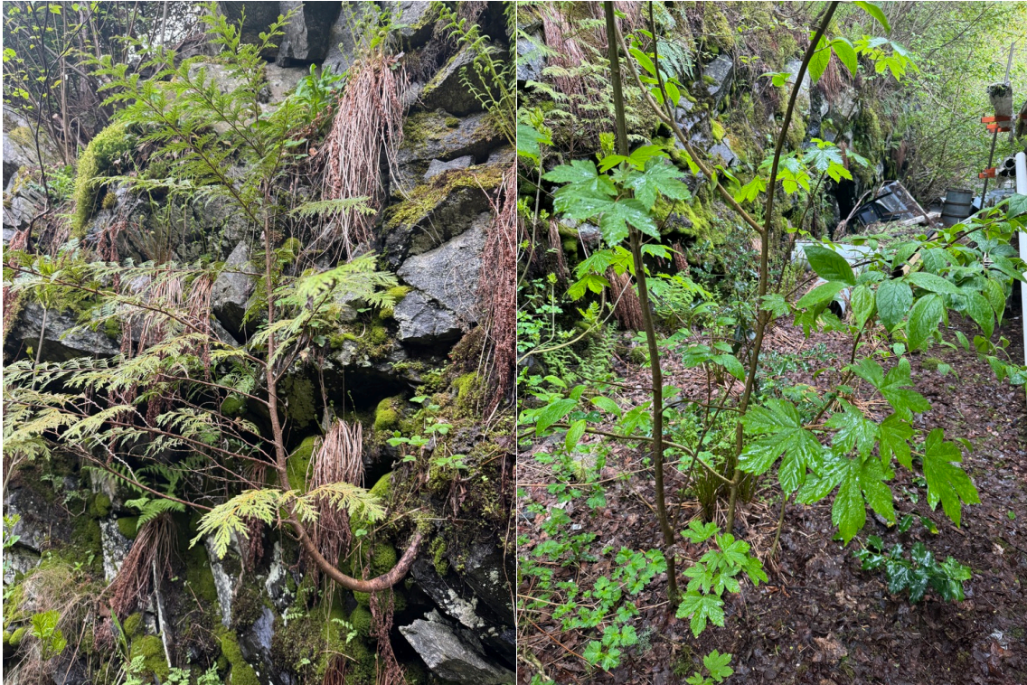
Figur 7. T.v.: Spredt forekomst av tuja (HI) på bergveggen øst for lagerbygget. Dette var det eneste spredningen observert fra de store trærne over bergveggen. T.h.: Platanlønn (SE) har flere små forekomster bak lagerbygget, både på bakkenivå og oppover bergveggen.