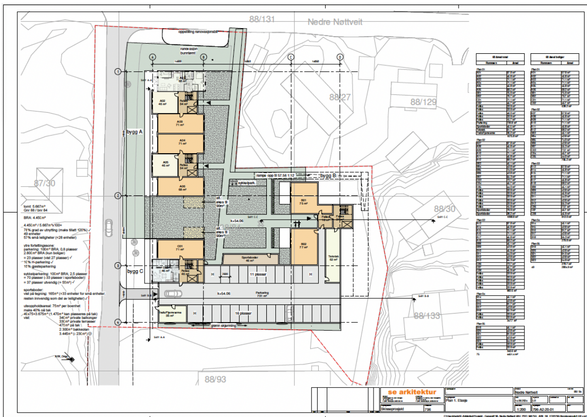
Figur 1. Skissering av planområdet, mottatt fra SE arkitektur 20.11.2024.

Dette notatet skal svare på naturmangfoldlovens §§8-10. For naturmangfoldlovens §§11-12, vil dette bli svart ut av forslagsstiller i deres planbeskrivelse.