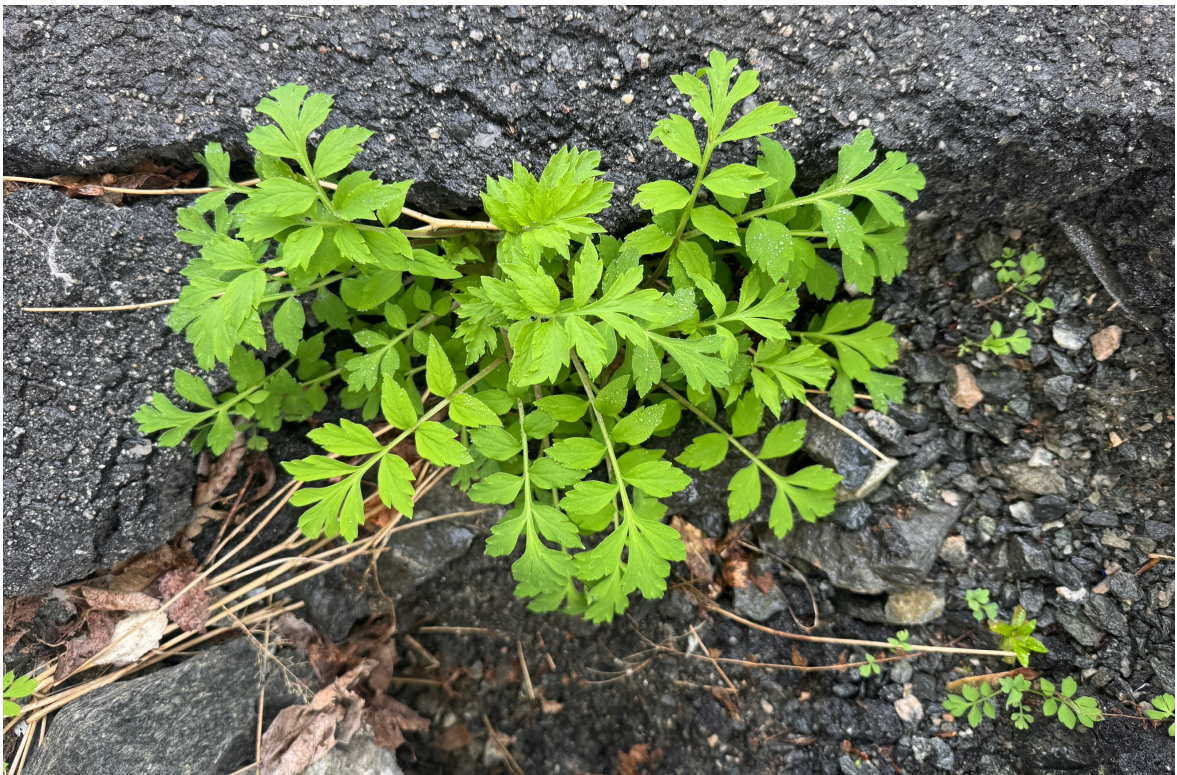
Figur 6. Gul valmuesøster (PH) vokser på asfaltsprekkene på nordsiden av lagerbygget.