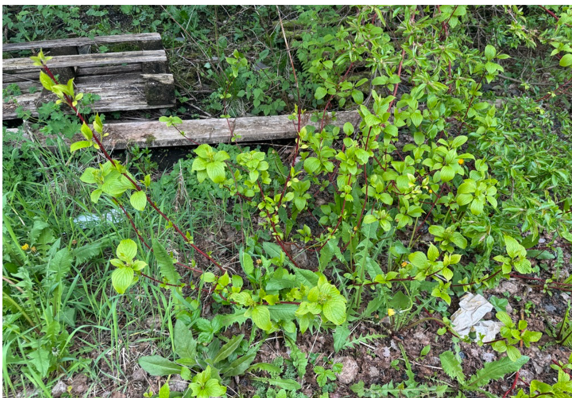
Figur 4. Det ble gjort en enkel registrering av alaskakornell (SE) nordøst for lagerbygget.