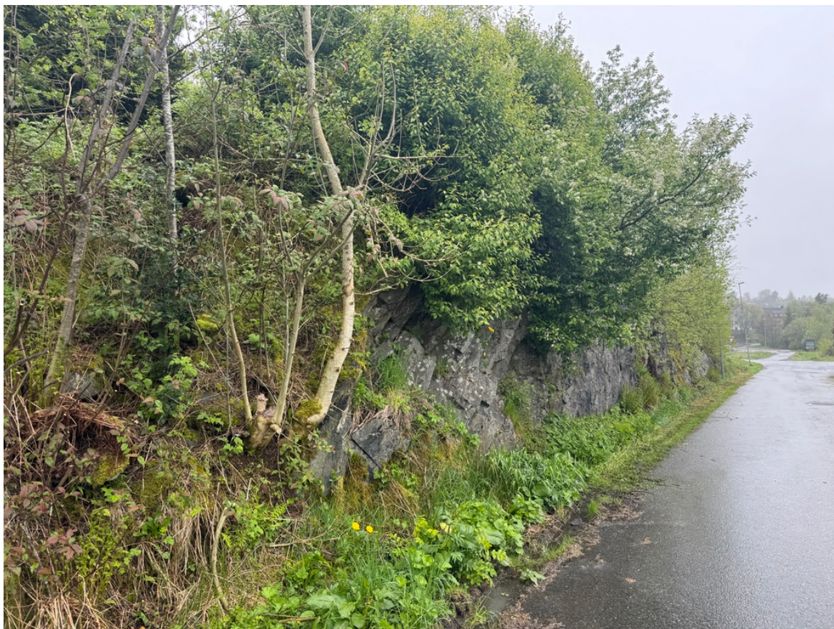
Figur 2. Inntil veien vest for lagerbygget og parkeringsplassen er det en høykant med en del unge trær og busker. Her er det spredning av sitkagran (SE), platanlønn (SE) og bulkemispel (SE). Det høye treet med den lyse stammen omtrent nesten midt på bildet er et ungt individ av ask (EN).

Det ble ikke registrert noen naturtyper etter Miljødirektoratets instruks innenfor planområder. Av rødlistearter ble det funnet et veldig ungt asketre (EN) langs veien i vest. Av fugl foreligger det én registrering av tyrkerdue (NT) i etterkant av befaring, men dette funnet er registrert som "stasjonær" som aktivitet, ved krysset ved siden av Extra Apeltun.