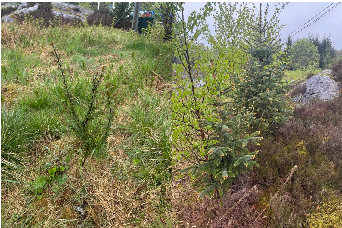
Figur 8. Enslig sprikemispelbusk (SE) vest for Coop Extra Apeltun. Sitkagran (SE) har flere spredninger her, men også på den smale stripen med vegetasjon mellom veien vest på planområdet og parkeringsplassen til lagerbygget.