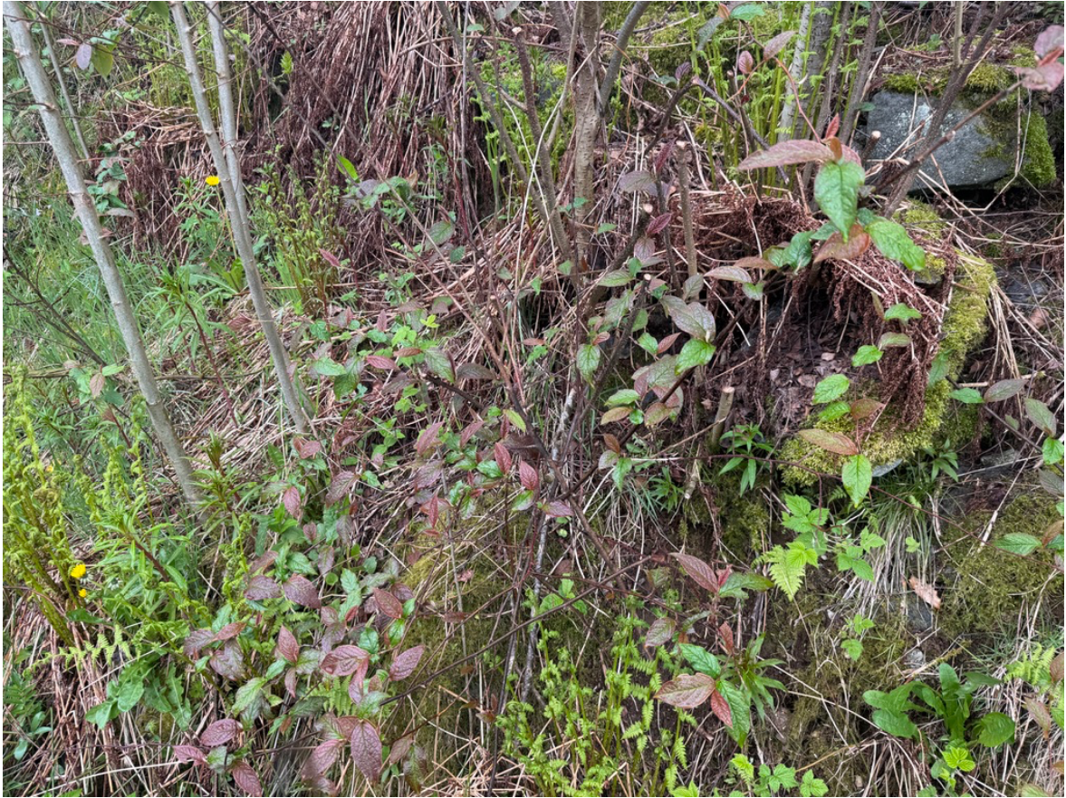
Figur 5. Bulkemispel (SE) er den mest utbredte fremmede arten innenfor planområdet. Den forekommer som større busker både i åpne områder og langs bergveggen i øst. Arten sprer seg hovedsakelig ved frøspredning, særlig via fugl.