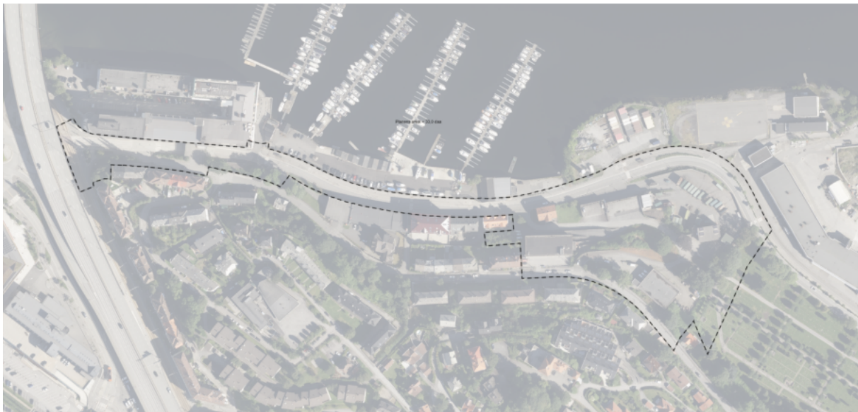
Figur 2 Planavgrensning

Formålet med en behandling etter forskrift om konsekvensutredning er å sikre at hensynet til miljø og samfunn blir tatt i betraktning ved utarbeidelse av planforslaget. Planprogrammet fastsetter hvordan planarbeidet skal foregå, hvilke temaer som skal utredes, og hvilke metoder som skal benyttes for utredningene. Forslag til planprogram skal fastsettes av Bergen kommune. Planforslag med konsekvensutredning skal så utarbeides på bakgrunn av det fastsatte planprogrammet.