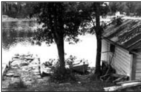
Fig. 6 Nauset med utsikt inn mot Skiparvika. UBB-KK-N-296/956