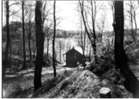
Fig. 5 Komponisthytten med utsikten ut mot Nordåsvannet i bakgrunn. UBB-KK-N-296/035