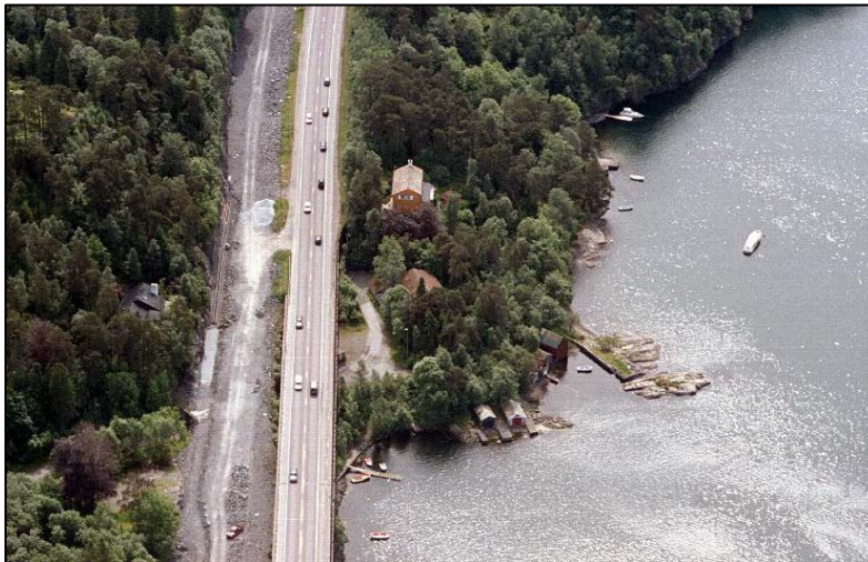
Fig 13 Bolighus og naustmiljø i Skiparvika.