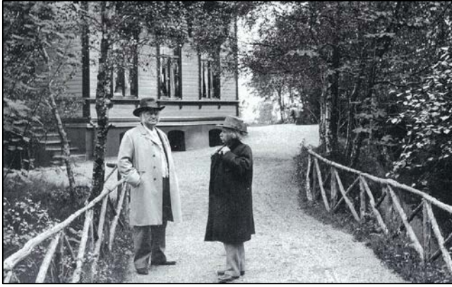
Fig 10 Bjørnstjerne Bjørnson og Edvard Grieg sammen på Troldhaugen i forbindelse med 60 års dagen til Edvard Grieg (Thowsen og Garmannslund 2002, 59).

I gjeldende reguleringsplan (plan id 6160000) er hele eiendommen regulert til spesialområdet bevaring. Troldhaugen ble åpnet som museum allerede i mai 1928 og ble i 2006 en del av stiftelsen Kunstmuseene i Bergen. Troldhaugen som kulturminne har høy verdi ut fra helheten, samspillet mellom den nasjonalromantiske musikken til Edvard Grieg og stedet der Grieg bodde og ble inspirert. Nasjonalromantikken kommer og til uttrykk i villaen, både arkitektonisk og innredningen som er preget av norsk