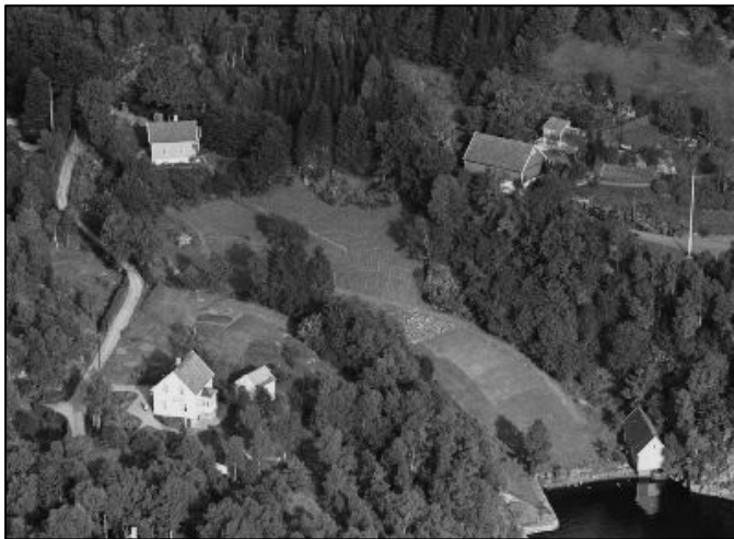
Fig. 2 Søre Hope. UBB-W-SH-005604.

Innerst inne i viken mellom Troidhaugen og murvillaen i Troidhaugvegen 80 ligger det et lite gårdsbruk, eller rester etter det som har vært et lite gårdsbruk. Dette var opprinnelig husmannsplassen Hestatræet, under hovedbruket på Hop. Ved utskiftingen ble det skilt ut som eget bruk omtalt som Søre Hope eller Stølen. 2 Både våningshuset, naust og driftsbygningen står i dag. Trass i et nyere påbygg på våningshuset er det fremdeles lesbart at dette i