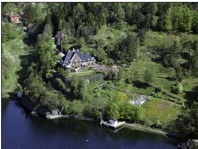
Fig 11 Villa, hage og badehus i 1961. UBB-W-F-017220.

Alexander Grieg kjøpte gårdsbruket Søre Hope i 1915 og fikk i 1916 bygget en villa like sør for gårdstunet. Det er arkitektene Arnesen og Darre Kaarbø som har tegnet villaen. Huset er en klassisistisk murvilla bygget i teglstein i kombinasjon med søyler, trapper og plater i granitt. I tillegg til et skifertak er det flere detaljer i kobber. Et tilhørende parkanlegg med tilhørende badehus var en del av helheten. Badehuset har en klassisistisk utforming, trekledning og valmtak med sinkbeslag. 5 Ut fra eldre bilder ser en også at er stor