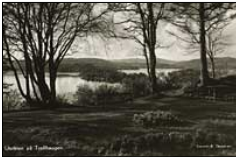
Fig. 8 Utsikt til Nordåsvannet fra Troidhaugen. UBB-BROS-05450.