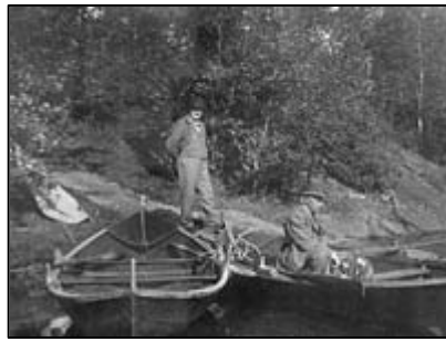
Fig. 7 Frants Beyer og Edvard Grieg. UBB-KK-N-296/052