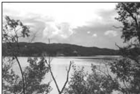
Fig. 9 Utsikt til Nordåsvannet fra Troidhaugen. UBB-KK-N-296/006