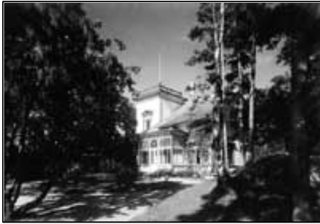
Fig. 4 Troidhaugen, Edvard Griegs villa. UBB-KK-N-296/027.

villaen. Det er Schak Bull som har utformet gravstedet. Gravstedet er enkelt med kun Griegs navn hugget inn. 4