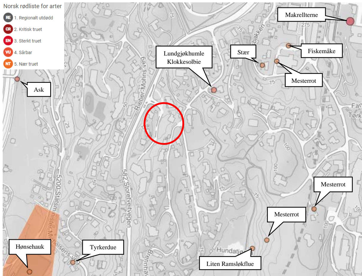
Figur 2: Oversikt over registrerte rødlistede arter i nærområdet