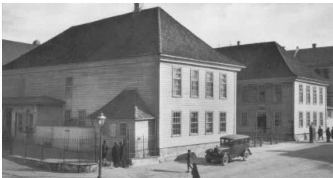
Fig. 23) Komediehuset, teatersalen.