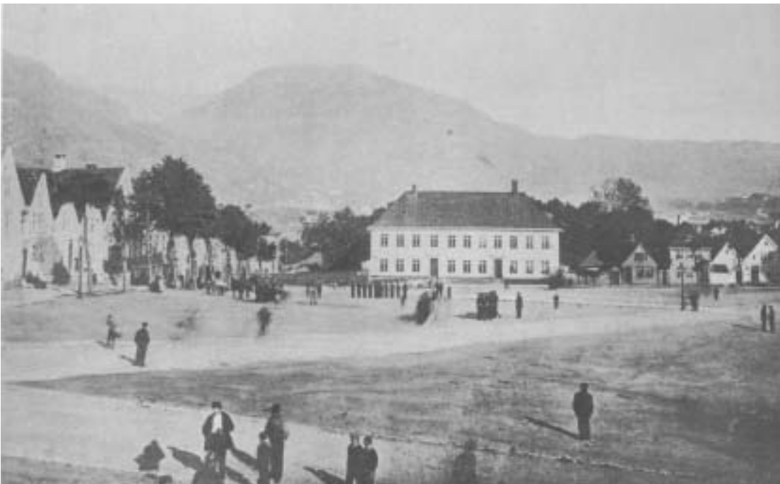
Fig. 21) Logens nybygg og Logehaven, 1884.