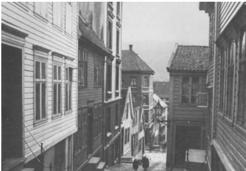
Fig. 8) Blandingsbebyggelse med murgårder fra 1890-tallet: Fra Strangebakken på Nøstet.