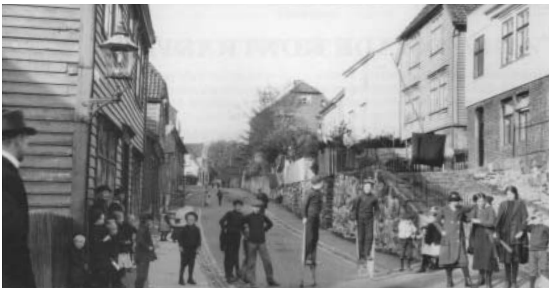
Fig. 14) Ladegårdsgaten ca 1912. Arbeiderboligen nr. 48 til venstre i bildet.