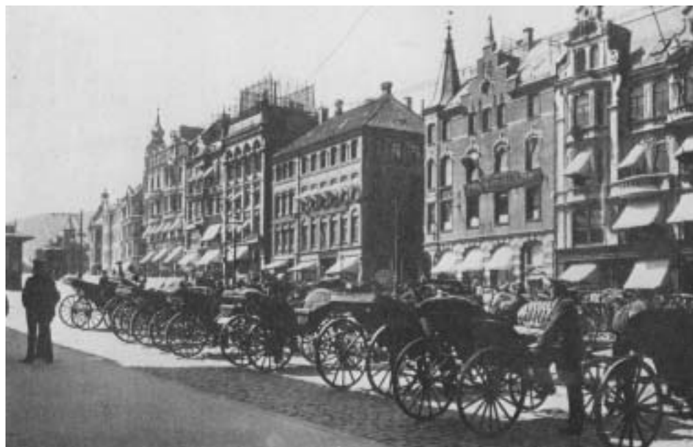
Fig. 4) Torgallmenningen 1898.