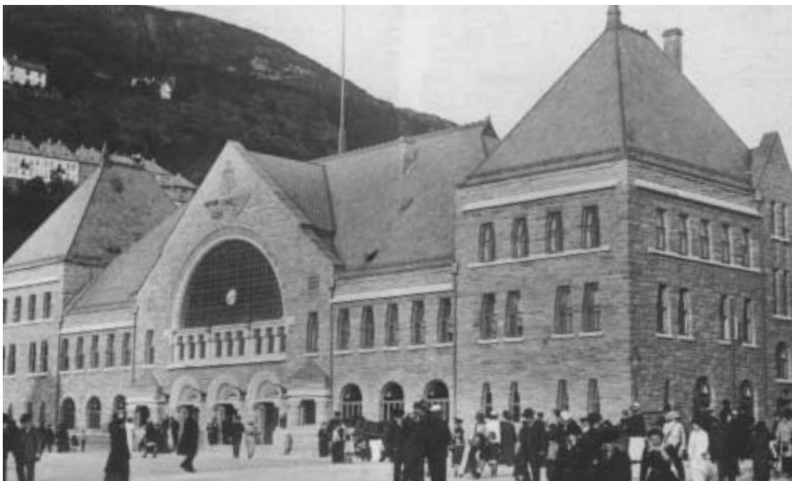
Fig. 12) Jernbanestasjonen, 1913.