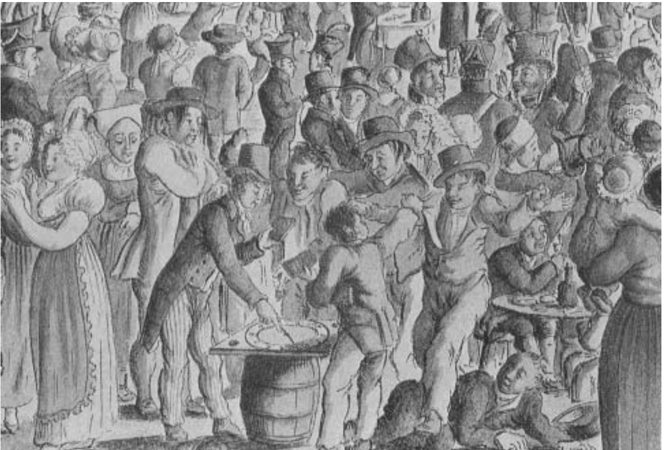
Fig. 13) J.F.L. Dreier, 1818: Fra St.hans-festen på Sydnes (utsnitt).