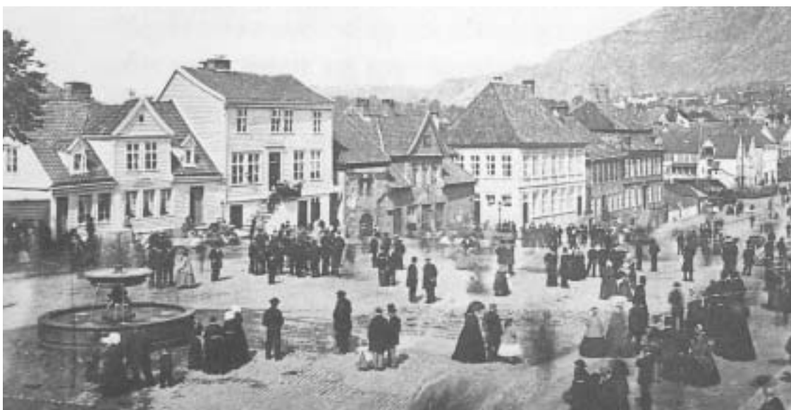
Fig. 15) Torgallmenningen med "Vandkunsten", ca. 1865.