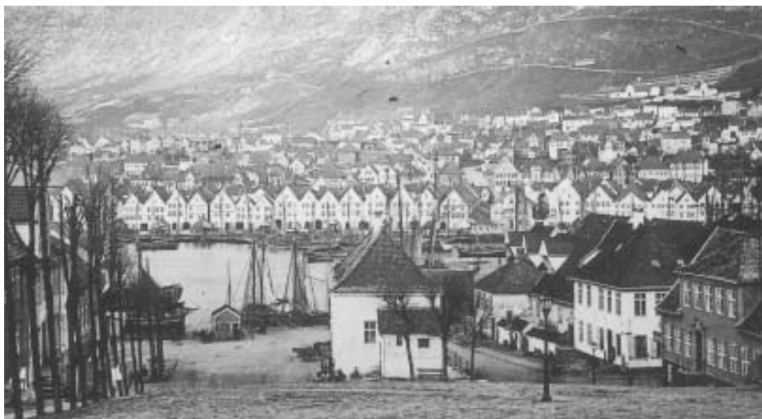
Fig. 3) Utsikt fra Murallmenningen mot Bryggen, ca. 1860.