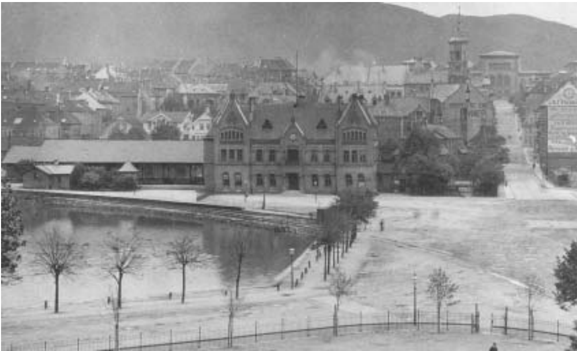
Fig. 11) Vossebanestasjonen ved Lille Lungegårdsvannet.