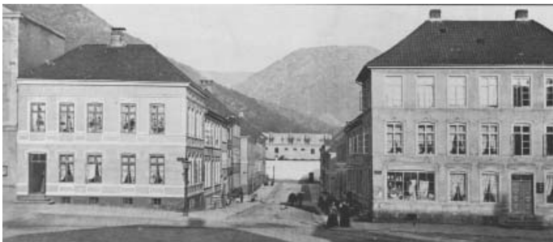
Fig. 6) Torgallmenningen: Senklassisistisk bebyggelse fra etter 1855-brannen.