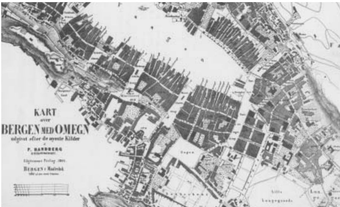
Fig. 1) P. Handbergs bykart fra 1864.