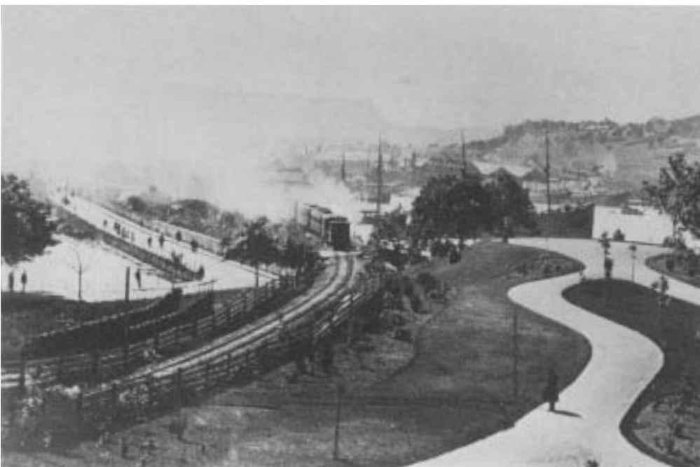
Fig. 10) Broene over Nygårdsstrømmen sett fra Florida, 1885.