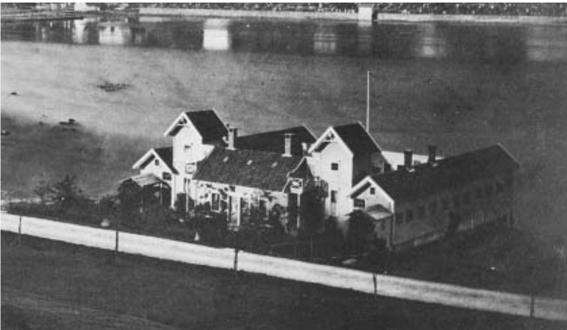
Fig. 19) Bonges Badehus ved østenden av Store Lungegårdsvann. Bygget 1863.