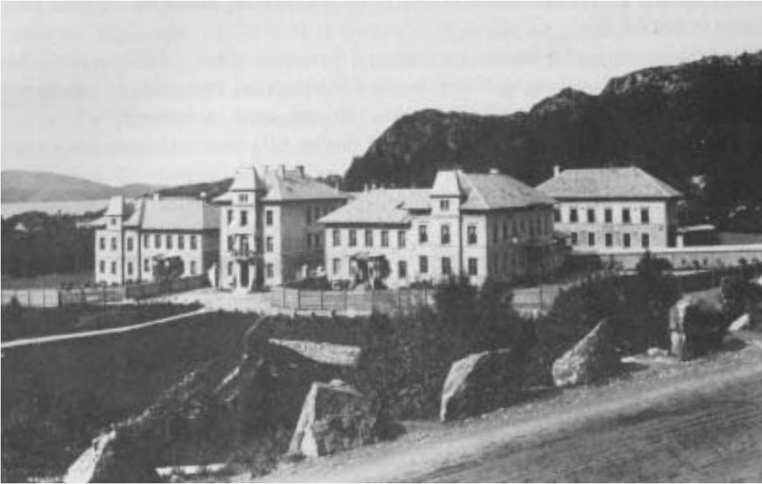
Fig. 18) Neevengaarden sykehus, tatt i bruk 1893.