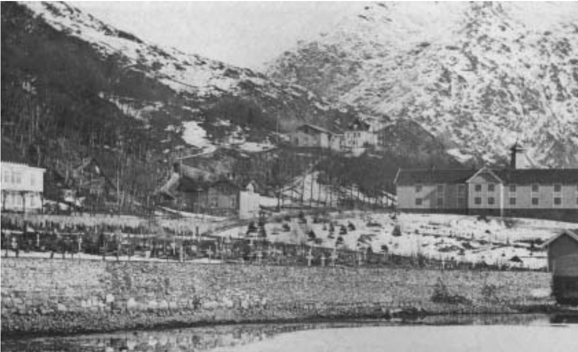
Fig. 16) Pleiestiftelsen og koleragravplassen på Assistentkirkegården, 1860.