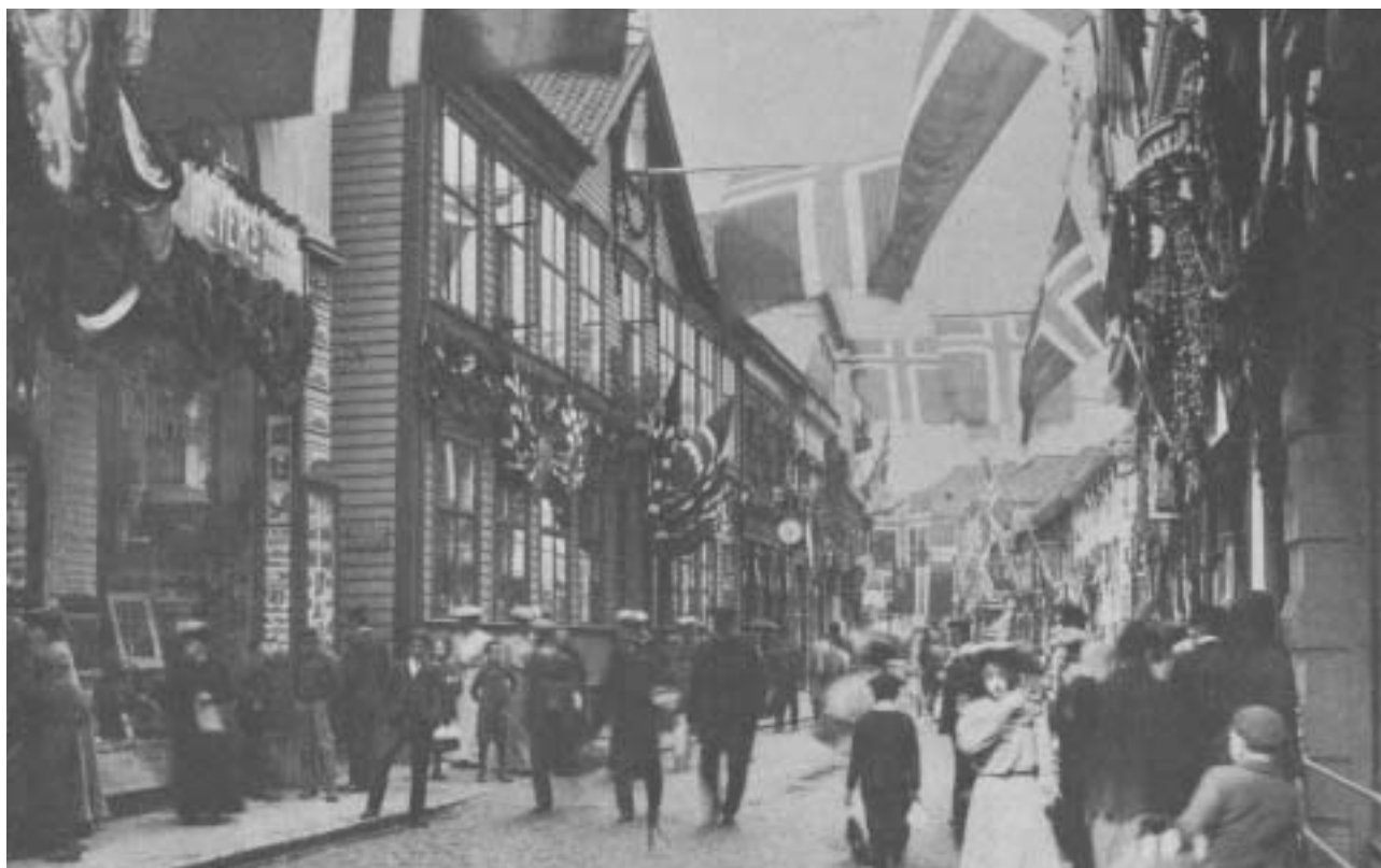
Fig. 24) Strandgaten ved kongeinntoget i 1906. Svaneapoteket midt i bildet. Huset er ombygd med nye vinduer og en ny takark ca. 1880.