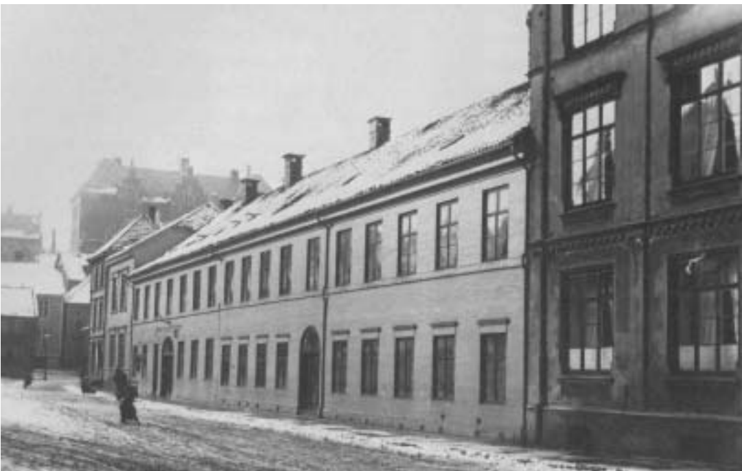
Fig. 17) Det gamle sykehuset på Engen.