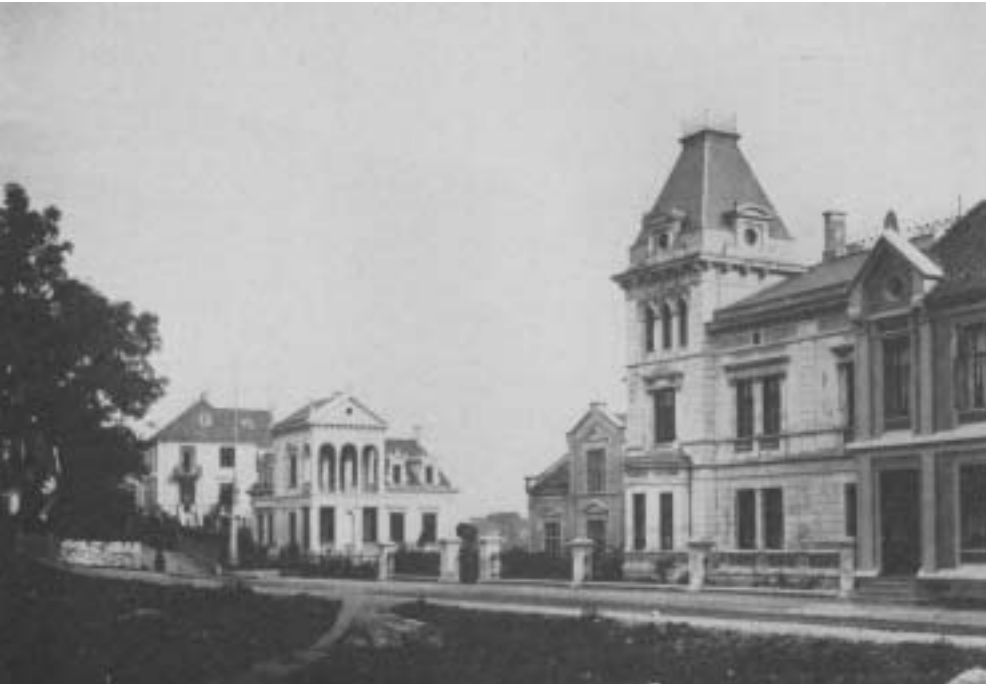
Fig. 9) Nygårdshøyden. Villaer på Muséplass ca. 1900.