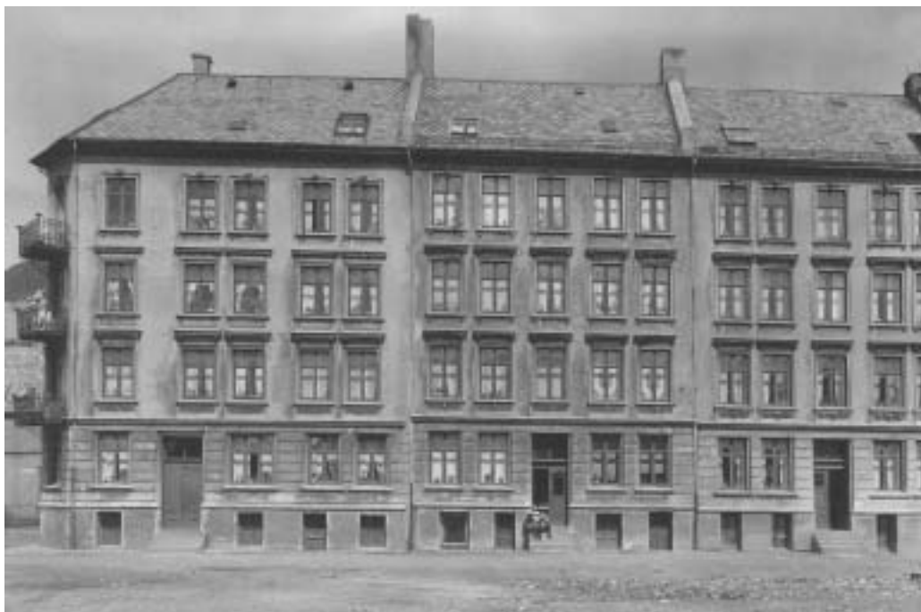
Fig. 7) Arbeidsgårder i Nonneseterkvartalet.