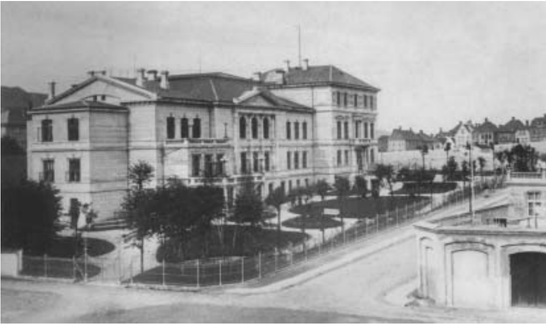
Fig. 20) Engen 1865. Den gode Hensigts bygning, revet 1880.