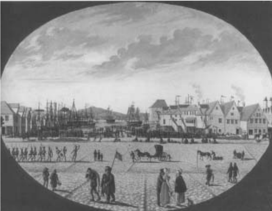
Fig. 2) J. F. L. Dreier: Torget og Zacchariasbryggen, 1817.