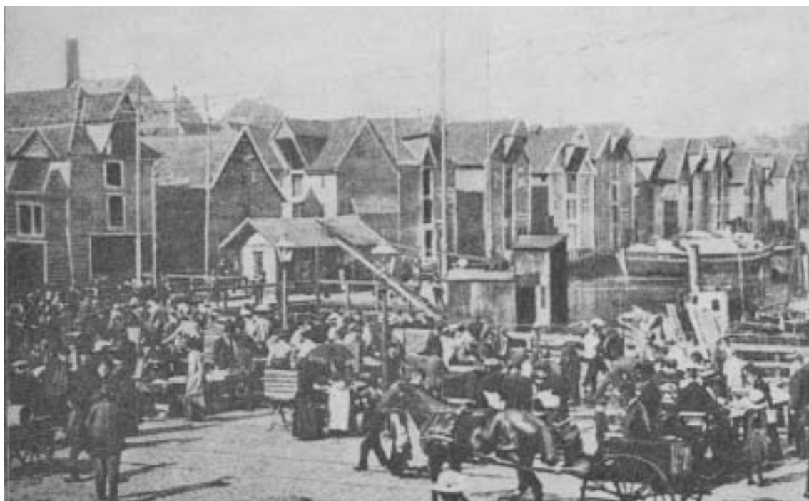
Fig. 5) Sjøhusbebyggelse mellom Torget og Murallmenningen, ca. 1910.