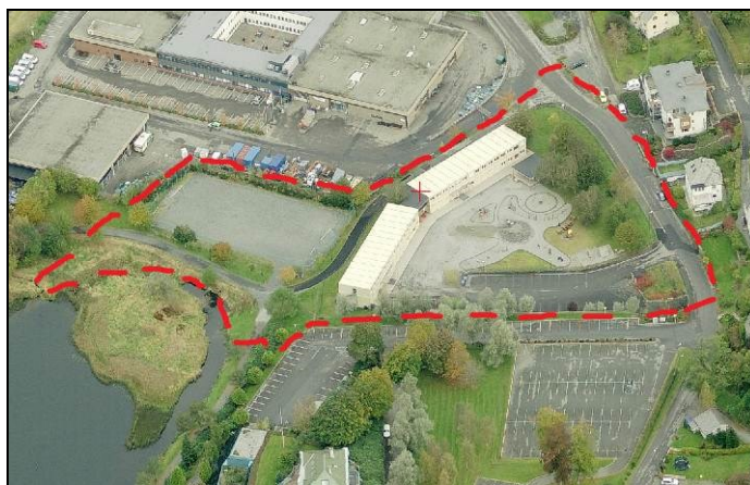
Figur v.: oversiktskart. Figur h.: Planområdet sett fra sør, midlertidige barnehage ca. midt i planområdet

I 2006 ble det fattet vedtak om å etablere midlertidige barnehager på utvalgte steder i Bergen (jf. tiltaksplan for full barnehagedekning, bystyresak 272/06). I den forbindelse ble det oppført en barnehagepaviljong nord for Kristianborgvannet. Planarbeidet er igangsatt for å regulere en permanent barnehage som erstatter dagens midlertidige barnehage.