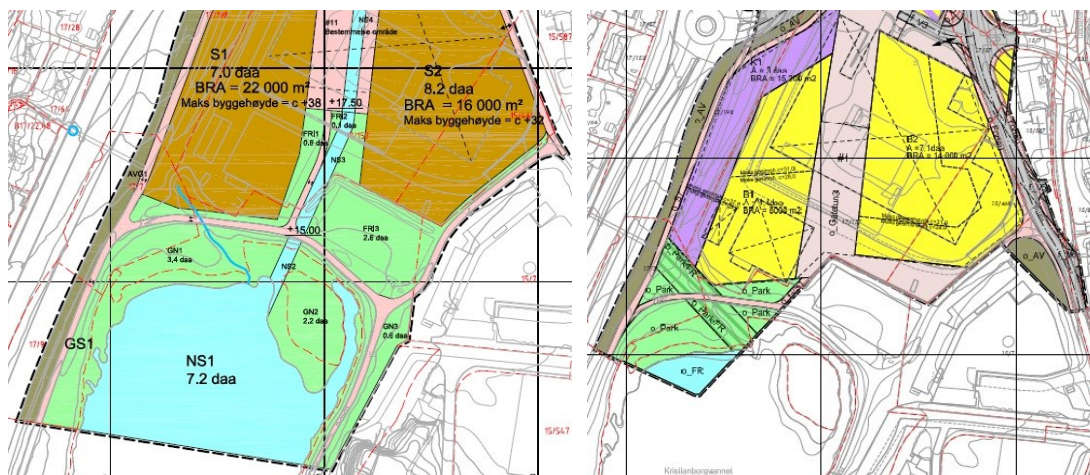
Utsnitt fra henholdsvis områderegulering Mindemyren (offentlig ettersyn august 2012) og reguleringsplan for Mindeporten (offentlig ettersyn februar 2012).

Ved eventuelle krav om erstatningsareal skal det tas utgangspunkt i barns faktiske bruk av arealet (før etablering av den midlertidige barnehagen), samt nytteverdien for lek og opphold i dag og i fremtiden. Før en eventuell omdisponering av arealer som er i bruk/egnet til lek og opphold, skal det dokumenteres hvordan kravene til lekemuligheter i området kan oppfylles – herunder arealer store nok og egnede for lek og opphold, muligheter for ulike typer lek på ulike årstider av ulike aldersgrupper, samt muligheter for samhandling mellom barn, unge og voksne. Når det gjelder nytteverdien for lek og opphold i fremtiden, må det tas hensyn til pågående planarbeid i området; områderegulering for Mindemyren (arealplan-ID 61140000) og detaljregulering for Mindeporten (arealplan-ID 60400000).