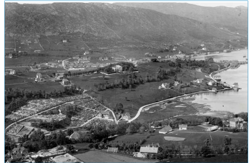
Kronstad Hovedgård. Utsnitt av foto tatt fra Kalfaret/Bellevue ca. 1860.

Hageanlegg har oftest fulgt endringer og trender innen kunsten, og en har mange eksempler på at nye eiere har justert eller endret hagens form og innhold. Så - med mange eiere av Kronstad har en god del endret seg både med hus og hage, kanskje mest hagen.