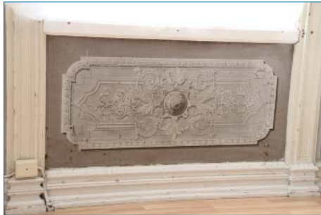
Brystningsfelt under vinduene. Malte stukkimitasjoner i lyse, gråhvite farger.