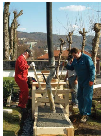
Dugnadsarbeid 2007/2008

Opprinnelig har dette trolig vært en innvendig dør. Både selve dørbildet og ornamentikken over var i svært dårlig stand, og deler måtte lages nytt. I 2. etasje finnes ytterligere to slike dører som ennå ikke er restaurert. Både dører og listverk stammer fra Amelns tidligere bygning på stedet.