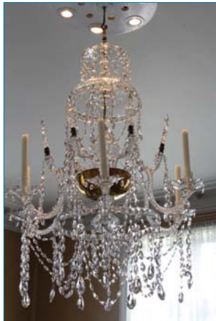
I første etasje henger en prismelysekroner som trolig er fra siste halvdel av 1800-tallet.