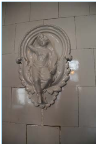
Kakkelovnen skinner i hvitt, dekorert med akantusblader og en kvinnefigur i draperier.

Aktive Krigsdeltakeres Forening (AKF) kjøpte Kronstad Hovedgård i 1973, og gikk straks i gang med stor dugnadsaktivitet på eiendommen.