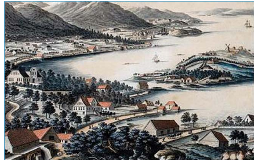
Kronstad sees helt til venstre i bildet med bueformet karnapp over hovedtrappen.

Prospect Af Bergen Optaget imod Westen i nærheden af Houkeland fra 1831 av Johan Fr. L. Dreiers.