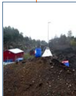
Jord og Kompost