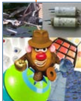
Miljøgifter i produkter