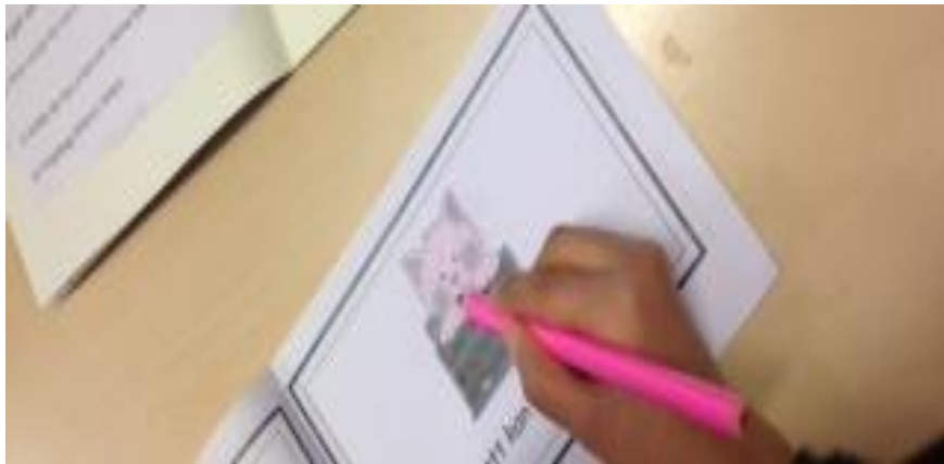
Vi leser og skriver om dyr