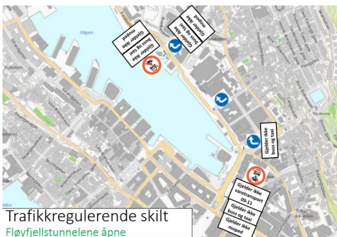
Figur 2 - Foreløpig skisse til skiltløsning

Når det gjelder løsninger for turbusser, anbefaler Sentrumsgruppen at videre detaljløsninger blir koordinert med pågående prosjekt med vurdering av løsninger for turbusser. I utgangspunktet forutsettes stengningen over Torget ikke å omfatte turbusser, ved bruk av forbudsskilt med underskilt: «Gjelder ikke buss og taxi».