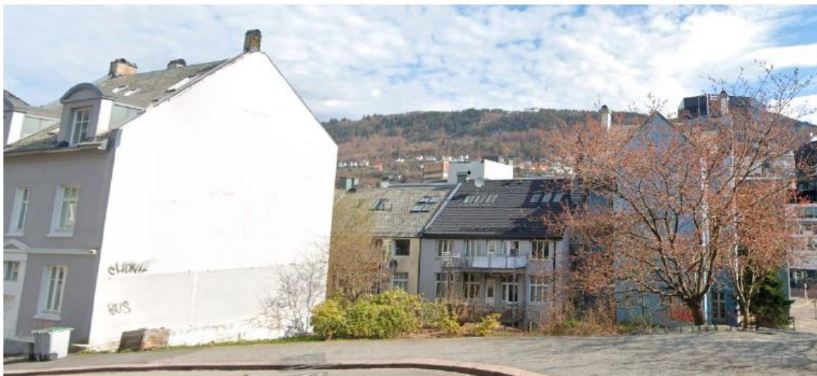
Fig 27: Kvartalet som skal lukkes med boligbebyggelse - slik ser det ut i dag.