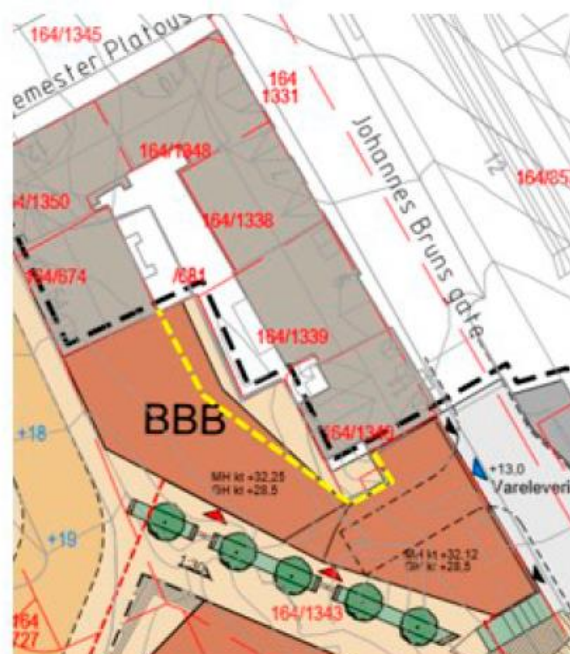
Fig 29: Illustrasjonsplan, påført forslag til byggegrense (gul stiplet linje)

Oppfølging av planvedtaket krever at plankartet endres for å få inn byggegrense innenfor BBB. Byggegrensen er vist på illustrasjon over, men referanse til feil figur gjør at det er nødvendig med administrativ korleksjon for å kunne gjennomføre endringen. Korleksjonen medfører at planvedtaket kan følges opp i tråd med bystyrets intensjon. Riktig benevnelse synlig i utklippet fra saksfremstillingen over.