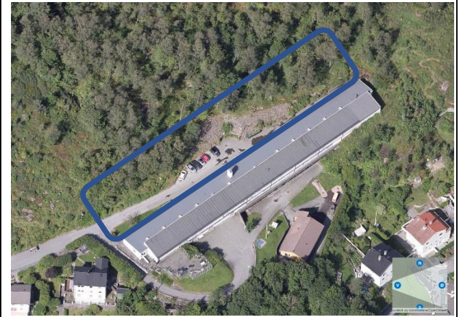
Figur 1. Flyfoto av dagens skråmur som utgjør den reelle avgrensningen av LNF-området.

Langs Holenstien er det avsatt 3 meter annet vegareal til nødvendige fyllinger og skråningsutslag etc., ved opparbeiding av Holenstien. Inn mot en liten del av dette arealet plasseres uteoppholdsarealer på dekke over parkeringsløsning. Det er tenkt at dette uteoppholdsarealet kan ha en funksjon for å sikre god bakkekontakt mellom takhage og terreng slik det er satt krav om i § 5.1.3 og 3.1.2.7.c i bestemmelsene.